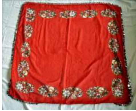
Fotoğraf 1. Örtü, çit örneği, Sivas (2014) (Photo 1. Cover, sample of çit, Sivas (2014))

Örtü, Çit: Üzerinde çeşitli süsler ve motifler bulunan başörtüsüdür. Fesin üzerine beyaz ya da farklı renkte ince tülbenkten, etrafı filkete ile yapılan, pul oyası dikilerek hazırlanan örtüdür. Elmalı gibi, üçgen şeklinde katlanarak başa giyilir. Üçgen şeklinde olmasının nedeni, başa kolay bağlanmasıdır (Fotoğraf 1).