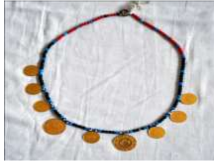
Fotoğraf 26. Beşibiryerde örneği, Sivas (2014) (Photo 26. Sample of Beşibiryerde, Sivas (2014))

Aksesuarlar: Bilezik, gerdanlık, küpe, hameyli, tuzluk, saç bağı, yanaklık, beşibiryerde gibi aksesuarlar kullanılır (Fotoğraf 26). Kadınların kullandığı aksesuarlardan biri de karanfil hızmasıdır. Karanfil hızması eskiden alevi kadınların kimliğini belirlemek ve onları diğerlerinden ayırmak için kullanılan bir simgeydi, daha sonra takı amaçlı dekoratif olarak kullanıldı. Hızma genellikle yaşlı kadınlarda yaygın olarak kullanılmaktadır (Yıldırım, 2015).