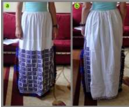
Fotoğraf 7. Göynek önden (a), arkadan (b) görünümü, Sivas (2014) (Photo 7. Front and rear view of the shirt, Sivas (2014))

Beyaz etamin veya pamuklu kumaşlardan dikilen ve eskiden uzun elbise olarak yapılan göynek, günümüzde etek altlarına giyilen ve jüpon görevi gören iç eteğe denilmektedir. Boyu 70-75 cm civarında olup, bel kısmı uçkurludur. Yanlarda 15-20 cm boyunda yırtmaçlar bulunur. Etek ucu ile yırtmaç hizasında kalan kısım etamin işi veya basit nakış teknikleri ile süslenir. Yırtmaç kenarları kaytan veya harçlarla temizlenir. Eskiden kadınlar künt işi yaparlarmış. Alt tarafında püskül ve pullar vardır. Arka kısmında yanlar etamin, ortası ise hasa bezidir. Etamin olan kısımların üzerine işleme yapılır (Fotoğraf 7).