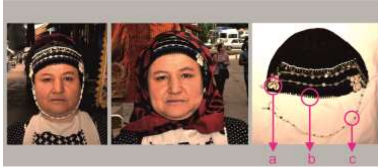
Fotoğraf 2. Fes örneği, Tokat-Zara (2015) (Photo 2. Sample of Fez, Tokat-Zara (2015))

boncuklar, iplikle oya yapar gibi dikilerek, dikiş kapatılır. Bu süslemeye de "tel" denir.