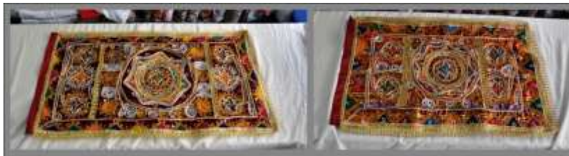
Fotoğraf 19. Öynük örneği, Sivas (2014) (Photo 19. Samples of apron, Sivas (2014))

Öynük: Üzerindeki nakışlar ve işlemler bakımından bir halı kadar kıymetli, kadın kıyafetlerinin göze ilk çarpan örtüsüdür. Üzerindeki motiflere göre, köy adlarıyla anılan çeşitleri vardır. Kadının iş yaparken önünün kirlenmemesi ayrıca önünün açılmaması ve içinin gözükmemesi yani ön tarafını örtmek için kullanılır. İlkel el tezgâhlarında dokunanlarına "şal öynük" denir. Şal öynüklerde "suyu", "gölü" ve "ay nakışı" motifleri bulunur. Tokat ve çevresinde hâlâ konar-göçer tezgâhlarda yün iplerle dokunan işlemeli ve basma türü kumaş önlükler kullanılır. Dokuma önlük, dokuma sırasında işlenir. Dokuma tezgâhının eni dar olduğu için, iki parça yan yana dikilerek, dikdörtgen şeklinde hazırlanır. Boyu dış sayadan kısadır. Uçlarına yün örme kuşak veya "kolan" dikilir. Kumaştan dikilen simli veya parlak önlükler, jarse ve basma gibi kumaşlarla astarlanır. Kadife üç peşlerin süslemesi gibi, tek renk kumaşlarla kenarları süslenir. Bir metre kumaştan dikilen önlük, yine kumaştan hazırlanan bel bağı ile kullanılır (Fotoğraf 19 ve Fotoğraf 20).