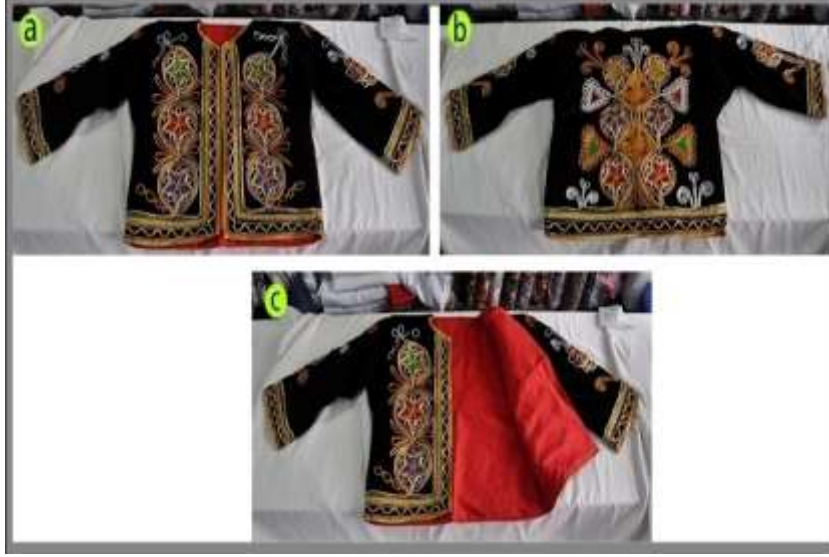
Fotoğraf 10. Salta'nın önden (a), arkadan (b) ve iç (c) görünümü, Sivas (2014)

(Photo 10. Front and rear view of the salta, Sivas (2014))