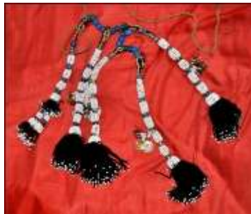
Fotoğraf 3. Saç bağı örneği, Tokat-Zara (2015) (Photo 3. Sample of Hairbond, Tokat-Zara (2015))

Çene Bağı/Çenelik: Fesin düşmemesi, sabit durması için, şakak kısmına dikilen ip, arkadan saçların altından geçirilerek tutturulur veya boncuklarla hazırlanan oya yine şakak kısmına dikilerek, çene altından geçirilir (Fotoğraf 2).