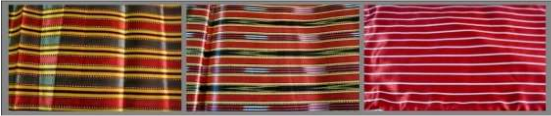
Fotoğraf 13. Darıca (sarılı kutnu), Karalı kutnu/Bindallı, Kamah ağalı, çubuklu kutnu), Sivas (2014) (Photo 13. Üç etek fabric names Darıca (sarılı kutnu), Karalı kutnu/Bindallı, Kamah (ağalı, çubuklu kutnu), Sivas (2014))