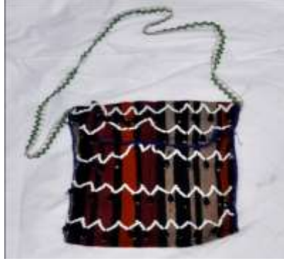
Fotoğraf 25. Tuzluk örneği Tokat-Zara (2015) (Photo 25. Sample of Tuzluk, Tokat-Zara (2015))

Aksesuarlar: Bilezik, gerdanlık, küpe, hameyli, tuzluk, saç bağı, yanaklık, beşibiryerde gibi aksesuarlar kullanılır (Fotoğraf 26). Kadınların kullandığı aksesuarlardan biri de karanfil hızmasıdır. Karanfil hızması eskiden alevi kadınların kimliğini belirlemek ve onları diğerlerinden ayırmak için kullanılan bir simgeydi, daha sonra takı amaçlı dekoratif olarak kullanıldı. Hızma genellikle yaşlı kadınlarda yaygın olarak kullanılmaktadır (Yıldırım, 2015).