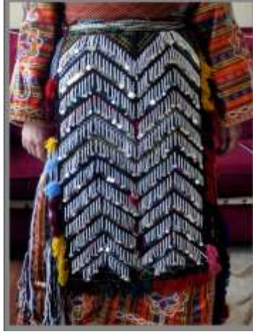
Fotoğraf 20. Öynük örneği, Sivas (2014) (Photo 20. Samples of apron, Sivas (2014))