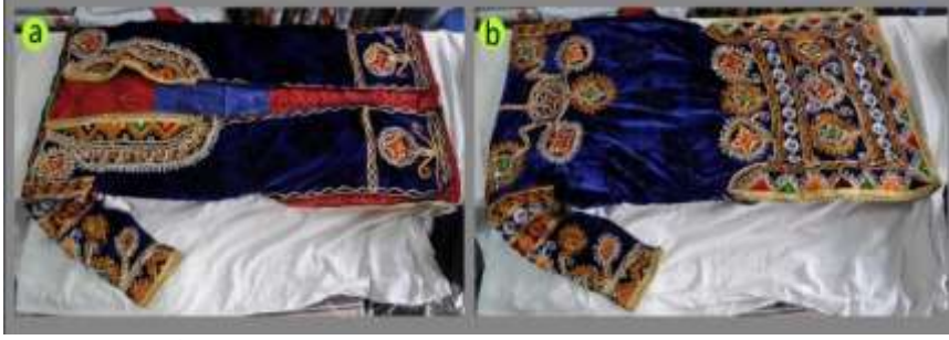
Fotoğraf 11. Kadife üç etek önden (a) ve arkadan(b) görünümü, Sivas (2014) (Photo 11. Front(a) and rear (b) view of the velvet, Sivas (2014))