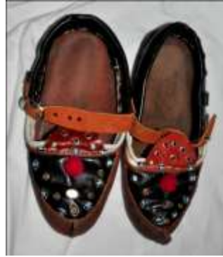
Fotoğraf 24. Aynalı çarık örneği, Tokat-Zara (2015) (Photo 24. Sample of Aynalı Sandal, Tokat-Zara (2015))

Çarık, Ayakkabı: Erkek kıyafetlerinde anlatıldığı gibidir. Kadınlar; sarı, kırmızı gibi sıcak renklerle süslenmiş olanlarını tercih ederler. Günümüzde çarık giyen hemen hemen hiç yok gibidir. Fakat eskiden çarık, yemeni, Laçın ve mest gibi giyecekler ayağa giyilmekteymiş. Ama günümüzde genellikle kara lastik, plastik ayakkabılar ve kunduralar giyilmektedir. Kadınlar gelin olurken genellikle ayaklarına aynalı çarık giyerler (Fotoğraf 24).