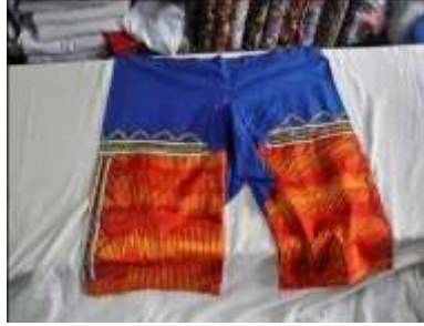
Fotoğraf 8. Tuman/Tıman,)Sivas (2014) (Photo 8. Shalvar, Sivas (2014))

Tuman/Tıman: Sıraçlar arasında atlas adı verilen; kutnu, ipek veya basmadan dikilen kıyafettir. Tumanın/tımanın ağ kısmı kısıdır. Üçgen şeklinde ek bir parça olan "ağ parçası" ile genişlik sağlanır. Bel ve paçalar uçkurlar ile büzdürülür. Astarlı dikilenleri de bulunur. Ama bu tür tuman/tıman giyildiğinde iç don kullanılmaz. Böylece diğer giyim parçalarının altından pek görülmez. Diz altına kadar inenleri de vardır. İki renklidir ve iki farklı kumaştan yapılmıştır. Alt tarafı kutnu üst tarafı pazendir. Terletmemesi için üst tarafı pazen olarak yapılmıştır. Günümüzde tek parça olarak da dikilmektedir (Fotoğraf 8 ve Fotoğraf 9).