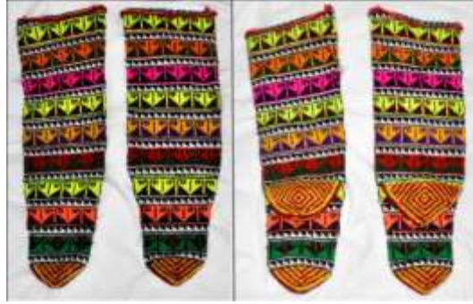
Fotoğraf 23. Çorap örneği, Tokat-Zara (2015) (Photo 23. Sample of Socks, Tokat-Zara (2015))

Çorap: Erkek giyimindeki alaca çorabın aynısıdır. Kadınlar da giyerler. El örgüsü olarak evlerde dokunan bu çorapların renklilerine "alaca" denir. Genellikle kırmızı renkli iplikler baskın olan çoraplara; sarı, beyaz, mavi renklerle nakış yapılır. Bu nakışlar "aynalı, oymalı, koyuk, bermak, makaslı, kilim ve kara yazma" gibi isimlerle anılır(Görsel 23).Renkler eldeki olanaklara göre seçilmekle birlikte, erkekler genellikle siyah ya da beyaz renkleri; kadınlar ise çift renkleri kullanırlar. Düz örülen çoraplara "şal çorap" denir.