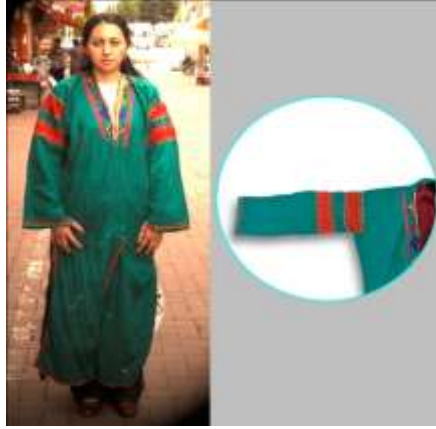
Fotoğraf 15. Üç-peşli örneği, Tokat-Zara (2015) (Photo 15. Üç etek fabric names, Tokat-Zara (2015))

Fotoğraf 15'de örnek olarak verilen üçpeşli'nin kollarında omuzluk olarak bilinen şerit kullanılmaktadır.