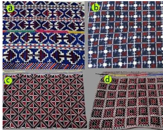
Fotoğraf 5. Göynek motifi örneği, a:kilim, b:kurtizi, c:üçkaya, d:şekerpare, Sivas (2014) (Photo 5. Samples of shirt, motif names, a:kilim, b:kurtizi, c:üçkaya, d:şekerpare, Sivas (2014))

Göynek: Erkek giyimindeki adı işlik, kadın giyiminde ise adı göynektir. Bu kıyafet, eskiden bezden veya çizgili kumaştan ve bedene göre uzun elbise şeklinde dikilmiştir. Günümüzde Amasya ilinde boyu kalça hizasında renkli, çiçekli pazen, basma ve patiska türü kumaşlardan hazırlanmaktadır. Tokat'ın Zile ilçesinde ise pazen ya da basma türü kumaş kullanılmaz, beyaz kumaşlara işlenir.