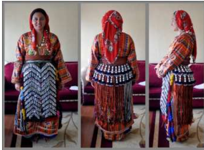
Fotoğraf 22. Sıraç Kadın Giyimi, Sivas (2014) (Photo 22. Sıraç Women's Clothing, Sivas (2014))

Yağlık, Yakalık: Bazı köylerde döşlük adıyla da bilinir. Kadınların boyunları ile göğüslerinin alt kısmı arasında takılan, genellikle beyaz renkli, ince kumaştan yapılan bir aksesuardır. Dış sayanın üstüne, boyun ve bel arasını kapatacak şekilde dikilir. Genellikle beyaz renkli kumaşlardan yapılır ve kenarları süslenir. Ön yakanın açık kısmından ve boyundan bağlanarak kullanılır. Kadınların göğüs kısmını kapatmak için kullanılır (Fotoğraf 21).