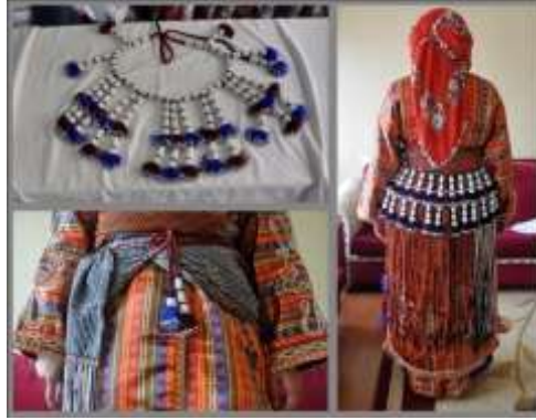
Fotoğraf 18. Bel bağı, Sivas (2014) (Photo 18. Waist band, Sivas (2014))

Arkabağ, Boncuklu Bel Bağı: Kimi Sıraç köylerinde "belbağı" olarak da bilinir. İnce beyaz boncuğun arasına göz boncuğu konulur; mavi, beyaz, lacivert ve kırmızı renklerden, ucu saçaklı, bele bağlanan süs eşyasıdır. Büyük boy mavi ve beyaz boncuklar yün iplere dizilerek, çeşitli uzunluklarda saçaklar hazırlanır. Hazırlanan saçakların alt ucunda kalan yün ipler çoğaltılır ve püskül haline getirilir. Püskül ipliklerin her birine küçük ve renkli boncuklar bağlanır ve dikilir. Yünden örülen kolan üzerine saçaklar yan yana getirilerek tutturulur. Kolan bele dolanarak bağlanır. Boncuklu bel bağı, arkalığın üzerine gelecek şekilde giyilir. Püskül kuşağın en üstüne bağlanır. Yöreye göre püskülde farklılıklar olabilir (Fotoğraf 18).