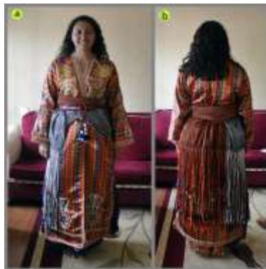
Fotoğraf 17. Kuşağın önden (a) ve arkadan (b) görünümü, Sivas (2014) (Photo 17. Front (a) and rear (b) view of the waistband, Sivas (2014))