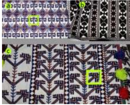
Fotoğraf 6. Göynek motifleri örneği, a: koçboynuzu, b: kara yazma, c: kazayağı, Tokat-Zara (2015) (Photo 6. Samples of shirt motif names, a: koçboynuzu, b: kara yazma, c: kazayağı, Tokat-Zara (2015))

Elbise şeklinde dikilen göynek iki parçadır. Kol altından bele kadar genişliği vermek için, "yan" ya da "genişlik" adı verilen parça dikilir. Yaka "V" kesimlidir ve açıklığı göğüs altına kadar uzanır. Kolları bol ve bileğe kadar gelir. Yakaları işlenmiş olanları da vardır. Göynek desenleri çıtırık, akça, kilim, kara yazma, kurt izi, şekerpare, kazayağı, keser ağzı, koçboynuzu, uçkaya olarak sıralanabilir (Fotoğraf 5 ve Fotoğraf 6). Koçboynuzu isimli göynek deseninde bulunan motif, koçboynuzuna benzediği için bu ismi almıştır. Benzer bir yaklaşımla kazayağı isimli göynek deseninde bulunan motif, kazın ayağına benzemesi nedeniyle bu ismi almıştır (Fotoğraf 6 a ve fotoğraf 6 c). "Köy Alevileri, özellikle Tahtacı'lar üç parmakla gösterilen ve kazayağı dedikleri bir işaret yaparlar. Bu işaret Allah-Muhammed-Ali üçlemesini simgeler" (Alkan, 2005:37).