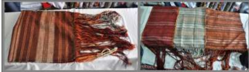
Fotoğraf 16. Püsküllü kuşak, Sivas (2014) (Photo 16. Fringed waistband, Sivas (2014))

Guşak, Arkalık: Yünlü kumaştan dokunan, çoğunlukla yaşlı kadınların bellerine sardıkları uzun bez giyecektir. Püsküllü kuşak 3 parçadan oluşur. Aşağıdaki fotoğraflarda püsküllü kuşağın dikilmemiş hali görülmektedir (Fotoğraf 16). Dikildikten sonra boncuk ve pul takılıp işlenir (Fotoğraf 17). Kuşağın üzerine takılan, uç kısmı püsküllü, yünden el tezgâhlarında dokunan giysidir. Sarı-kırmızı, beyaz-kırmızı, sarı-beyaz çizgili üçlü parçalar halinde, yan yana dikilerek, "oyulgama" ile hazırlanır. Arkadan sarkan ucuna 40-50 cm uzunluğunda saçak yapılıp, diğer ucu 15-20 cm içe kıvrılarak, arasına bağ geçirilip, bele bağlanır. Kastamonu ilinin Tosya ilçesinde dokunur.