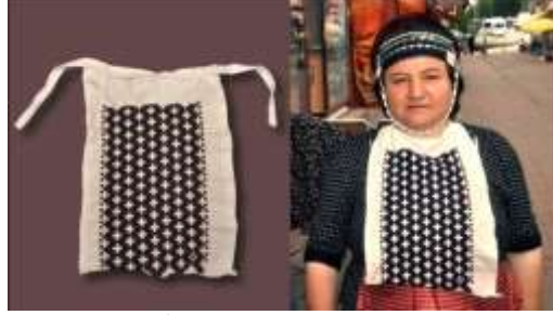
Fotoğraf 21. Yağlık / Yakalık örneği, Tokat-Zara (2015) (Photo 21. Samples of yağlık/yakalık Tokat-Zara (2015))

Yağlık, Yakalık: Bazı köylerde döşlük adıyla da bilinir. Kadınların boyunları ile göğüslerinin alt kısmı arasında takılan, genellikle beyaz renkli, ince kumaştan yapılan bir aksesuardır. Dış sayanın üstüne, boyun ve bel arasını kapatacak şekilde dikilir. Genellikle beyaz renkli kumaşlardan yapılır ve kenarları süslenir. Ön yakanın açık kısmından ve boyundan bağlanarak kullanılır. Kadınların göğüs kısmını kapatmak için kullanılır (Fotoğraf 21).