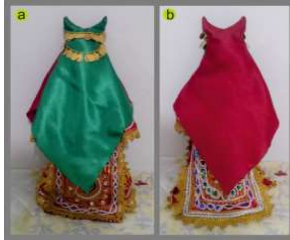
Fotoğraf 4. Duvağın önden(a) ve arkadan (b) görünümü, Tokat-Zara (2015) (Photo 4. Front and rear view of the veil Tokat-Zara (2015))

Alınlık: Fesin ön tarafına takılan ve gerdanlığa benzeyen altın, gümüş veya çeşitli madenlerden yapılan süslemedir. Eskiden Tokat'ın Zile ilçesinde gelin evden çıkmadan önce, duvağın üzerine bağlanırdı. Duvağın önü yeşil arkası kırmızı renkte olurdu, alınlık gümüş küçük paralardan oluşmaktaydı (Fotoğraf 4).