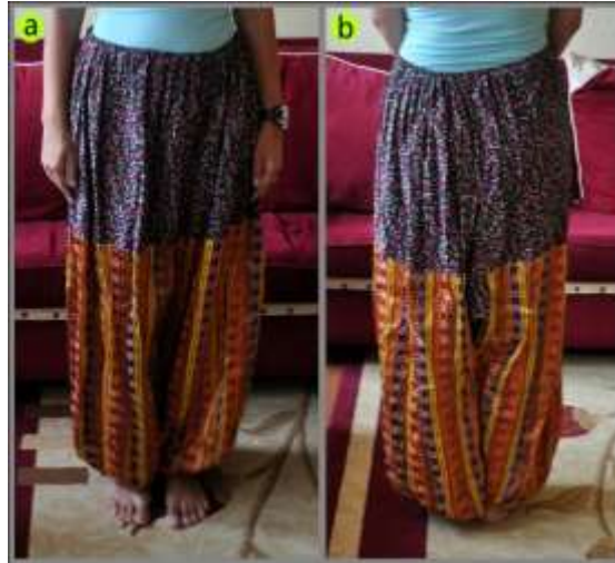
Fotoğraf 9. Tumanın/Tımanın önden(a) arkadan (b) görünümü, Sivas (2014)

(Photo 9. Front and rear view of the shalvar, Sivas (2014))