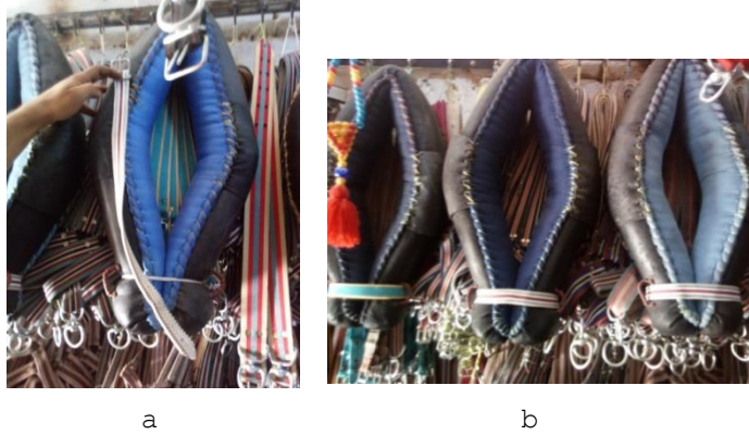
Fotoğraf 9. a)Kolon kayışı, b)kolon kayışı bağlanmış hali (Photo 9. a) Column strap, b) Column strap attached)