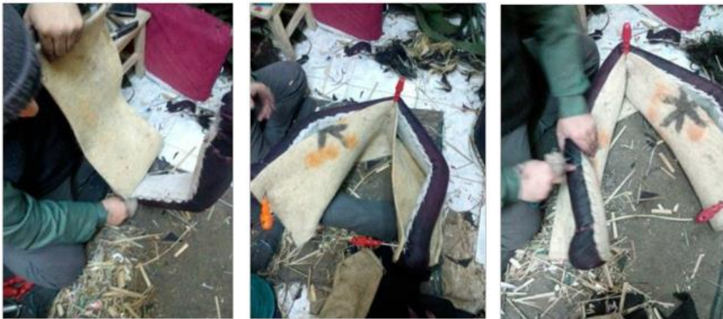
Fotoğraf 7. a) Keçenin ayrılması, b) Keçenin tutturulması, c) Keçenin dikilmesi (Photo 7. a) Separation of felt, b) Fixing of felt, c) Sewing of felt)

Dikme işleminden sonra kedenenin en önemli parçalarından biri olan keçe yine 15cm eninde 70cm boyunda olmak üzere kesilmektedir. Keçenin yumuşak ve doğal olması atın boyun kısmının yaralanmamasına ve acı vermeden kullanılması için önemli sayılmaktadır. Keçe genellikle Kahramanmaraş'tan temin edilmektedir. Keçe simittin boyunca ölçülüp, önce genel olarak bir en, boy ayarlaması yapılmaktadır. Sonra yine sazlık simittin uç kısımlarına gelecek şekilde simittin iç kısmına gerdirilerek keçe biz yardımıyla tutturulmaktadır. Daha sonra keçe yine kalın iğne kıyık ile sazlık simittin uç kısmından başlayarak diğer uçuna kadar her iki tarafı da dikilerek aplikasyonu sağlanmaktadır (Fotoğraf 7a, 7b, 7c).