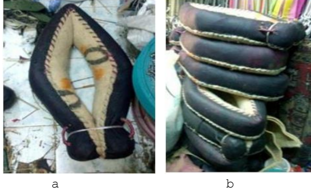
Fotoğraf 8. a)Derinin dikilmesi, b)Kedene uçlarının bağlanması (Photo 8. a) Sewing of the skin, b) Tying the ends of the kedene)

Keçe dikim işlemi bittikten sonra iki uç kısmı bağlanarak kalıbını alması için bir iki gün bekletildikten sonra kedene kullanıma hazır hale gelmiş olmaktadır (Fotoğraf 8a, 8b).