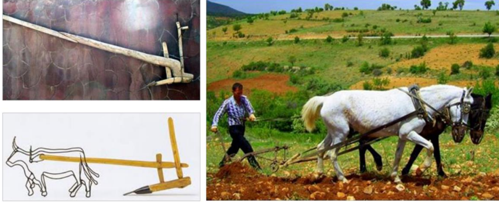
Fotoğraf 1. Karasaban ve kedene ile çift süren atlar [13] (Photo 1. Double-riding horses with karabasan and keden)

İnsanoğlu yüzyıllardan beri yaşamını sürdürebilmek için toprağı ekip biçmeyi sürdürmektedir. Tarlalardaki toprağın verimini artırmak, toprağı havalandırmak, yabancı otları çıkarmak ve tohum ekmeğe hazır duruma getirmek için toprağın belirli mevsimlerde çift sürmek gerekmektedir. Çift sürme işi yıllardan beri karasabanın (toprak sürmekte kullanılan ilkel tarım aleti) ata koşulmasıyla yapılmaktadır. Atın boyun kısmına geçirilerek karasabanın kol şeklinde ikiye ayrılmış ince uzun ağaç silindirlerin atın her iki tarafına bağlanıp sabanı atın gittiği yöne doğru hareket veren boyunduruğa "kedene" denilmektedir. Bir başka deyişle çift süren hayvanların boyunlarına takılan meşin halka, boyunduruğa "kedene" denmektedir. Dil bilimcisi Ömer Asım Aksoy, "Gaziantep Ağzı" adlı üç ciltlik eserinin üçüncü cildinde kedeneyi şöyle tanımlıyor: "Çift süren hayvanların boynuna takılan ve çok vakit içi keçe dolu, dışı deri ile kaplı olan oval ve kalın boyunluk." Kedene çekim hayvanlarının boyunlarının incinmemesi için yastık görevini üstlenir. Kısaca kedene, bir bakıma çift süren beygirlerin boyunlarına takılan halkadır (Fotoğraf 2), [12].