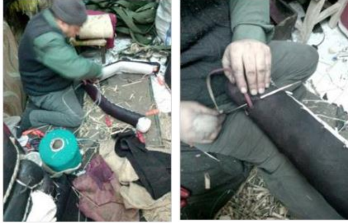
Fotoğraf 6. a) Derinin dikilmesi, b) Kolan kayış yerinin dikilmesi (Photo 6. a) Sewing of leather, b) Sewing of column belt)

Tutturulmuş deri sazlık simitte yöresel ismi "kıyık" olan kalın iğne ile sentetik kalın çuval ipliği yardımıyla dikilmektedir. Dikişler ne seyrek ne de sık olmadan nizami olarak el alışkanlığıyla gayet düzgün biçimde dikilmektedir. Dikiş işlemi sazlık simittin bir ucundan diğer ucuna varıncaya kadar her iki tarafına uygulanmaktadır. Derinin dikimi bitiminde sazlık simittin yumruklarının üzerine kolan kayış yerleri dikilmektedir (Fotoğraf 6a, 6b).