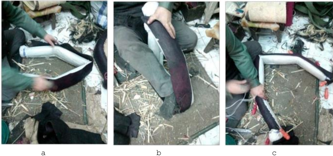
Fotoğraf 5. a) Derinin ayarlanması, b) Derinin gerdirme işlemi, c) Derinin tutturulması (Photo 5. a) Adjustment of the skin, b) Skin stretching process, c) Attachment of the skin)

Yumruk yapma işlemi bittikten sonra 15cm eninde kesilmiş olan yumuşak manda derisini simit yüzeyine ölçüm işlemi yapılmaktadır. Derinin yüzey ölçümünden sonra derinin simit yüzeyine iyice gerdirilme işlemi yapılmaktadır. Bu gerdirme işlemi ustanın ayağıyla simittin bir köşesine basması kuvvetlice çekmesi suretiyle olmaktadır. Bu gerdirmeyle deri iyice simitte yapışmış ve düzgün bir yüzey elde edilmek için yapılmaktadır. Çünkü ileriki zamanda derinin ve diğer malzemelerin sarkmasının önüne geçilmesi içinde önemli sayılmaktadır. Gerilmiş derinin sazlık simittin her tarafında aynı gerginlikte olması önemli olduğu için deri sazlık simitte özellikle uç kısımlarından tornavida ve bizlerle iyice tutturulmaktadır (Fotoğraf 5a, 5b, 5c).