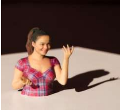
Görsel 11. Minyatip 3D isimli firmada üretilen bir heykel (A sculpture that produced in Minyatip 3D. 2015, Erişim: 08.04.2016, http://www.minyatip.com/detaylar/#fiyatlar )

Türkiye’de özellikle mühendislik fakültelerinde 3 boyutlu yazıcı üretimine yönelik girişimler bulunmaktadır ancak üniversite bünyesinde açılan 3 boyutlu yazıcı merkezleri sınırlı sayıdadır. 2014 yılında açılan ilk 3 boyutlu yazıcı merkezi, Kadir Has Üniversitesi bünyesinde, Mühendislik ve Doğa Bilimleri Fakültesiyle Sanat ve Tasarım Fakültesinin hazırladıkları ortak bir projeye hayata geçirilmiştir. Kalkınma Ajansına sunulan proje, başarılı bulunmuş ve FabLab adı altında 3 boyutlu yazıcı merkezi kurulmuştur ( http://www.khas.edu.tr/news/1024 ). Ticari amaçla şahısların açtığı 3 boyutlu yazıcı merkezleri de bulunmaktadır. Bu merkezlerden biri de 2015 yılında Ankara’da açılan, Minyatip 3D isimli firmadır.