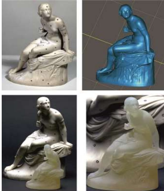
Görsel 1. Tarama yapılmış bir heykelin aslı ve modelin rp yöntemiyle photo polimerden üretilmiş kopyası (Maquette & Fine Art Scanning (Erişim: 04.04.2016, http://www.cyberfx.com/maquette_scan.htm )) (Image 1. A Sculpture screened of the original and model rp model photopolymer produced copy)