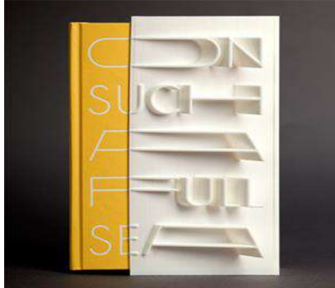
Görsel 6. MakerBot firması tarafından üretilen 3 Boyutlu kitap kapağı tasarımı (Çatal, D., (2016). Usage of experimental typography of book cover design in digital age) (Image 6. By MakerBot firm produced 3D book cover design)

modellerin oluşturulması, stop motiona yönelik karakter ve senaryolara ilişkin sistemler, görme engellilere yönelik dokunsal yapıların algılanması, ambalaj tasarımına yönelik yeni konseptlerin geliştirilmesi gibi tasarım problemlerinin çözümünde bir araç olarak düşünülebilir (Sampaio, Spinosa vd., 2014:26). Bu yeni teknolojinin kitap kapağı tasarımında kullanılmasıyla oldukça farklı bir yaklaşım denenmiştir. Koreli yazar Chang-rae Lee'nin "On Such a Full Sea" isimli romanının kapağı 3 boyutlu yazıcı kullanılarak üretilmiştir (Görsel 6). Tasarımcı bir röportajında kapağı tasarlarlarken, kitabın bir sanat nesnesi olduğunu hatırlatmak istediğini ifade etmiştir (Çatal, 2016:570).