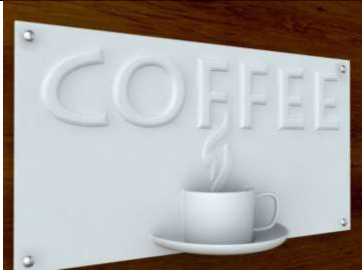
Görsel 9. Cgtrader firması tarafından üretilen bir tabela örneği (3d printable coffee sign with text STL OBJ. Erişim: 04.04.2016, https://www.cgtrader.com/3d-print-models/art/signs-logos/3d-printable-coffee-sign-with-text-stl-obj )

(Image 9. An example of a signboard produced by Cgtrader)