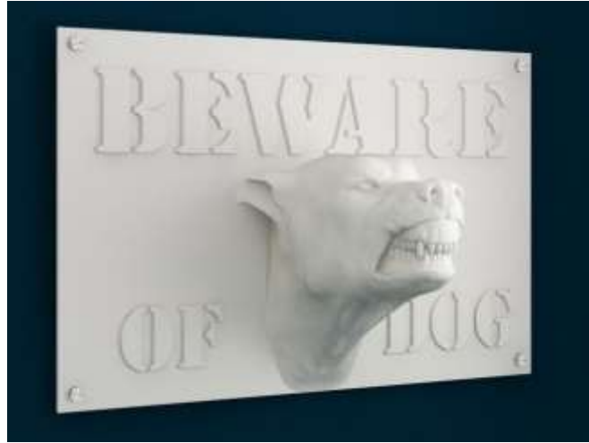
Görsel 8. Cgtrader firması tarafından üretilen bir tabela örneği (3d Printable Beware of Dog sign, Erişim: 04.04.2016, https://www.cgtrader.com/3d-print-models/art/signs-logos/3d-printable-beware-of-dog-sign ) (Image 8. An example of a signboard produced by Cgtrader)