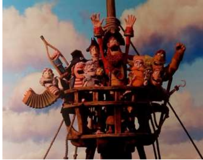
Görsel 5. Aardman Animasyon Stüdyosu, 2012, Korsanlar (Hoskins, S., (2013). 3D printing for artists, designers and makers, London: Bloomsbury Publishing, ss:125) (Image 5. Aardman Animation Studio, 2012, Pirates)

yazıcıdan çıktısını almak daha ucuza mal olacaktır. Animasyon stüdyoları, karakterlerin 3 boyutlu parçalarının print edilmesinin, maliyeti düşürmesi ve süreci hızlandırması gibi yararlarının yanı sıra, sürece yaratıcı faydalar sunduğunu ve stüdyolara daha büyük bir yaratıcı özgürlük verdiğini fark etmişlerdir. Örneğin karakterlerde daha güçlü yüz ifadeleri elde edebilmek için, birçok ağız şekli üretilebilmiştir (Hoskins, 2013:124). Üç boyutlu yazıcıyı kullanarak uzun metrajlı bir film üreten ilk firma Laika'dır. Laika firmasında üretilen bu film, Henry Selick'in 2009 yılında yayınlanan Caroline isimli filmidir. Aardman animasyon stüdyosu, Peter Lord ve Jeff Newitt tarafından yönetilen Pirates filmiyle, 3 boyutlu yazıcıyı kullanmaya başlamıştır (Görsel 5). Pirates filmi için kukla karakterlerin, Envisiontech makineleri kullanılarak baskısı yapılmış, yaklaşık olarak 500.000 parça üretilmiştir (Hoskins, 2013:124-126).