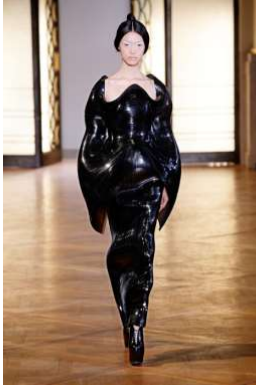
Görsel 4. Iris van Herpen, 2012-2013, Hybrid Holism (Erişim: 20.04.2016 http://www.irisvanherpen.com/DOCS/IVH-hybrid_holism.pdf ) (Image 4. Iris van Herpen, 2012-2013, Hibrid Holizm)