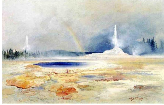
Görsel 18. Thomas Moran, The Castle Geyser Fire Hole Basin, Suluboya, 18.5x27.5cm

Büyüleyici ışık huzmeleriyle ulvi ya da kutsal olanı; resimlerinde kullandığı kendiliğinden dağılan şeffaf boya tabakaları ile bu dünyanın dışında varolduğuna inandığı süblim, soyut bir evrenin olduğunu ortaya getiren Thomas Moran, bu anlamda izleyenleri de bu evrene davet etmektedir (Görsel 18). Sanatçı boyaların kendi şeffaflığında geçişgenlikle oluşan biçimsel etkilerle varolan ışığın şeffaflığını bizlere verirken ulvi olanın içerisinde bu dünyanın ötesini bizlere de göstermeye çalışmaktadır. Moran katı kontur çizgileriyle sınırlandırılmış nesnelere kullanılmaktan öte renklerdeki şeffaflığın içinde kaybolan sınırlarla ışığındaki sınırsızlığı/sonsuzluğu resmetmektedir.