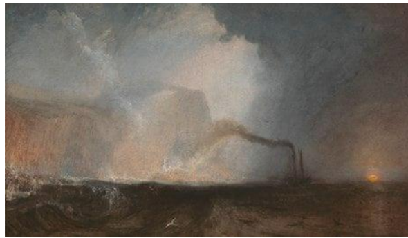
Görsel 19. Joseph Mallord William Turner, Fingal's Cave, tuval üzerine yağlıboya, 90.8x121.3cm

Bir önceki dönemde yapılan manzara resimlerinden farklı olarak yaptığı resimlerde deneyim, gözlem ve yaşantının gerçekliğini ön plana alan Turner yüce/süblim kavramını bu bağlamda resmetmiştir (Görsel 19). Turner'ın geniş açılı deniz manzaralarında, gökkuşağına boyanmış dağlarında ve yarattığı sisli ortamlarında manzara resmi, filozofların süblim/yüce diyerek kuramlaştırdıkları düşsel ve doğaüstü bir nitelik kazanmıştır. Sanatçı bu kavramları somut olarak kimi zaman bir fırtınanın içerisinde kendini gemi direğine bağlayarak kimi zaman da dalgaların şiddetiyle duyumsayarak hissettiklerini resimleriyle ortaya koymuştur. Doğaya ait olanı tüm hücrelerinde hisseden Turner'ın bu yüceliği içselleştiren ruhundan artakalan tüm kırıntılı resimlerdeki her bir leke ve fırça vuruşlarında bizler de yaşayabilmekteyiz.