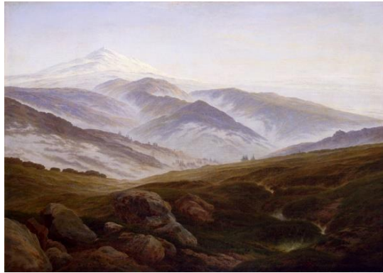
Görsel 10. Caspar David Friedrich, The Giant Mountains , tuval üzerine yağlıboya, 73.50x102.50cm (Visual 10. Caspar David Friedrich, The Giant Mountains , oil on canvas, 73.50x102.50cm)

Caspar David Friedrich'in resimlerinde varolan "yüce" kavramı; aslında kendi içerisinde ruhun ıssız ve yalnız duygulara dalarak kendini aynı anda hem huzur hem de korku ve endişeleriyle yüzyüze getirdiği karşıtlığıyla bizlere sunmuştur (Görsel 10 ve Görsel 11). Sanatçının resminde oluşan bu ruhsal karşıtlık, manzaralarında izleyiciye sunduğu kuşbakışı görünümü ile verilen gerilimli atmosferle sağlanmaktadır. Uçsuz bucaksız ortaya getirdiği bu manzara resimlerinde insansızlaşmış göz alabildiğine engin alanlarla ıssızlığın hem ruhsal hem de fiziksel anlamda algılanan gerçeği ile izleyiciyi karşı karşıya getirir. Nietzsche'ye göre "Doğa bize aldırmadığından doğanın ortasında kendimizi öyle rahat hissederiz ki" (1997:36) bu şekilde aslında enginlik bizlerin bir düşünme sığınağıdır.