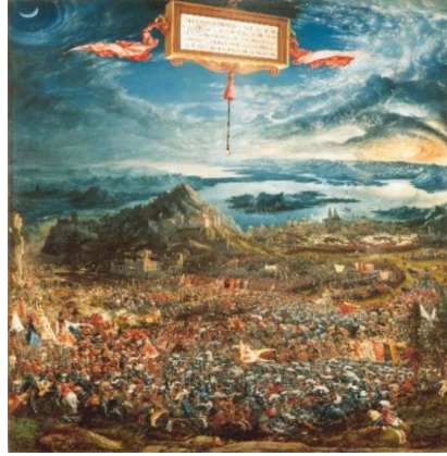
Görsel 4. Albrecht Altdorfer, The Battle of Alexander at Issus, Tahta üzerine yağlıboya, 158.4x120.3cm (Visual 4. Albrecht Altdorfer, The Battle of Alexander at Issus, Oil on board, 158.4x120.3cm)

Albrecht Altdorfer'in resimlerinde manzara resimlerinin / peyzajlarının egemen olduğu tablolarında dinsel öyküler, olaylar anlatılmıştır. Aşağıda verilen "The Battle of Alexander at Issus" isimli resminde, mavi dağların üzerinden kan kırmızı bulutlarla donmuş güneş ile soluk renklerle, gerçekdışı gizemli bir atmosfer verilmiştir (Görsel 4 ve Görsel 5). Sanatçı bu eserinde coşkunu, zengin ve mutluluk dolu bir üslup ortaya koymuştur. Formlar, çizgiler ve renkler zorlanmaksızın, akıcı bir şekilde yaşayan bir doğayı anlatmıştır. Sanatçının resimlerinde peyzaj çeşitli renklere bürünmüş, bitkilerle biraz daha canlandırılmıştır. Sanatçı, manzara resminin bir tür olarak kabul edilmediği bu dönemlerde erken bir manzara ressamı olarak dikkat çekmiştir (Eroğlu, 2007).