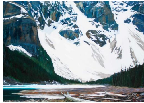
Görsel 21. Robert Florian, Moraine Lake, tuval üzerine yağlıboya, 30x40cm (Visual 20. Robert Florian, Moraine Lake, oil on paper, 30x40cm)

Günümüz sanatçısı Robert Florian'nın resimleri bizleri Batı Kanada'nın yüce manzaraları ile tanıştırmıştır. Sanatçının eserleri hem cesur hem de etkileyicidir (Görsel 21). Florian, etrafındaki toprak parçalarının kendi içindeki erdemli, güçlü yanını soyutlamalar olarak görür. Sanatçının çalışmaları zirvelerin engebeli süblim dinamik manzara resimlerini izleyicilere sunmaktadır. Kullandığı güçlü tonlar, hızlı ve spontan fırça darbeleri ve cesur renkleri izleyiciye sunduğu tasvirlerde kendini gösterir. Gasset,