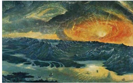
Görsel 5. Detay, Albrecht Altdorfer Alexander savaşı ayrıntısı (Visual 5. Detail, Battle of Albrecht Altdorfer Alexander detail)