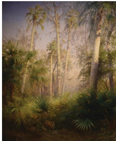
Görsel 7. Herman Ottomar Herzog, Tilki, tuval üzerine yağlıboya, 65x56cm (Visual 7. Herman Ottomar Herzog, Fox, oil on canvas, 65x56cm)

Almanya'nın Bremen kentinde doğan Herzog aslen dağların ve Alman arazisinin doğal ihtişamının çekiciliğine kapılmıştır. Vahşi doğanın yüce ve ehlileşmemiş/evcilleşmemiş unsurları, sanatçının manzara resmini sürdürme kararının arkasında önemli bir itici güç haline gelmiştir. Ağaçların tepeleri resimde kesilerek, burada işlenenden daha uzun ve görkemli olduklarını göstermiştir. İzleyicinin bakış açısı, kompozisyonun altındaki korkmuş tilki seviyesindedir. Böylece izleyici doğanın gücünü hatırlamaktadır (Görsel 7) (Grim ve Gary, 2017).