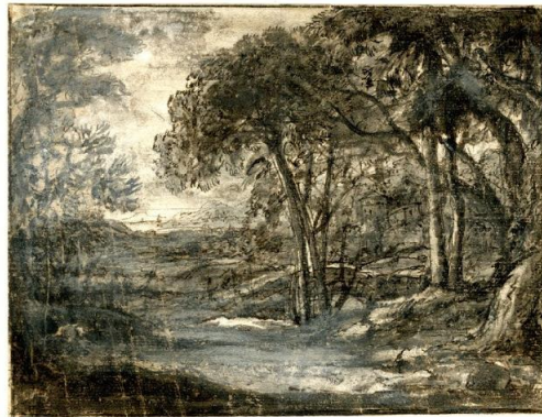
Görsel 2. Claude Lorrain, Pastoral Landscape, kâğıt üzerine çizim (Visual 2. Claude Lorrain, Pastoral Landscape, drawing on paper)

Avrupa sanatında peyzajın arka plan olmaktan kurtulması zaman almıştır. Orta Avrupa'nın büyük şairi Rainer Maria Rilke, Mona Lisa'daki peyzaj görüntüsünü aklında tutarak, "manzara resmini/peyzajın sözcüklere sığmayan deneyimi anlatmanın bir aracı olduğunu hisseden" ilk kişinin Leonardo da Vinci olduğunu yazmıştır. Rilke manzara resmini/peyzajı, "ötekine" ya da dünyada "insana karşı kayıtsız olan" her şeye seslenen sanatsal bir araç olarak görmüştür. Claude Lorrain'in 17. yüzyıldaki peyzajlarında (ana görüntü), sözü edilen "öteki" asla içine giremeyeceğimiz ancak ağaçların gölgesi ve ılık yaz havası arasındaki atmosfere ait geçişlerle havasını soluduğumuz bir Arkadya dünyasından oluşmaktadır (Görsel 2 ve Görsel 3). Viktorya dönemi sanatçısı ve eleştirmeni John Ruskin, Claude'un güneşi bir obje olarak doğrudan tasvir eden ilk ressam olduğunu gözlemiştir ve bunun "sanatta bir devrim olduğuna inandığını belirtmiştir (Bird, 2016:98-99). Claude'un Hollandalı çağdaşlarının peyzajlarında alelade çiftlik arazileri ve kıyıları yer almaktadır. Claude'un peyzajlarındaki şiirsel uzakları izleyici yakından hissedebilir.