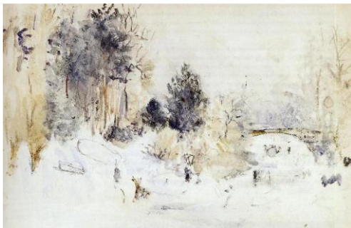
Görsel 16. Berthe Morisot, Snowy Landscape, Suluboya, 36.8x45.4cm (Visual 16. Berthe Morisot, Snowy Landscape, Watercolor, 36.8x45.4cm)

Gasset (1998:100) "Bir yaprağın yeşilinde hazdan titreyerek bir gece geçiren su damlacığı öylesine gevezeleşir ki, kendisini evrende pek de gerekli bir şey sanır. Oysa tan sökümünde güneşin altın şarabını içmeye başlayacak ve öyle sarhoş olacaktır ki, yapraktan aşağı, yere yuvarlanacak, toprağa çarpıp paramparça olacak, ufukta kabaran güneş de onun moleküllerini dört bir yana dağıtacaktır" sözleri doğanın coşkuyla parçalanışını bizlere eşsiz bir şekilde hissettirir. Berthe Morisot aşağıda verilen manzara resimlerinde bu coşkuyu ve lirik parçalanışı suluboya tekniğiyle adeta doğaçlama yapılan resimlerinde görsel olarak etkili bir biçimde betimlemiştir. Bitmemiş eskizler olarak üretilen manzara resimleri; hafif pastel tonları, puslu atmosferi ve geniş gevşek fırça vuruşları ile bize varlığımızın ne kadar geçici olduğunu bir kere daha hissettirir (Görsel 16 ve Görsel 17).