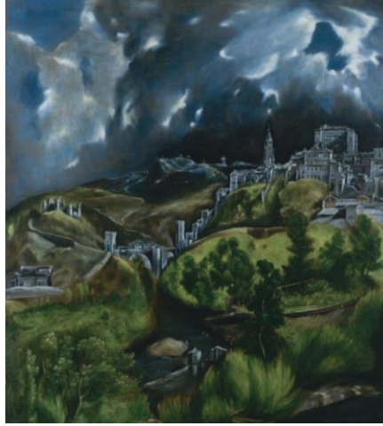
Görsel 6. El Greco, Toledo Manzarası, Tuval üzerine yağlıboya, 121x109cm (Visual 6. El Greco, Toledo Skyline, Oil on canvas, 121x109cm)

Hemen arkasından da El Greco'nun Toledo manzarası öne çıkmaktadır (Görsel 6). Gasset (1998:98) "Bak şimdi bakışlarımı dağların zikzaklı çizgisinde gezdirdikçe belleğimde El Greco'nün fırçasından çıkmış morumsu insan imgeleri canlanıyor. Bu dağlarda da tıpkı o adamların gözbebeklerindeki gibi her türlü değişime meydan okuyan yüce bir süreklilik ifadesi var" sözleriyle manzarayı nasıl insanlaştırdığını ifade etmiştir.