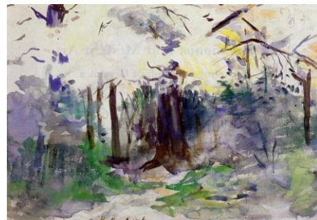
Görsel 17. Berthe Morisot, Autumn in the Bois de Boulogne, Suluboya (Visual 17. Berthe Morisot, Autumn in the Bois de Boulogne, Watercolor)