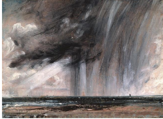
Görsel 8. John Constable, Seascape Study with Rain Cloud, kâğıt üzerine yağlıboya, 22.2x31.1cm (Visual 8. St. John Constable, Seascape Study with Rain Cloud, oil on paper, 22.2x31.1cm)

Yüksek bir duygusal tepki üretmeye odaklanan Romantizm 19. yüzyılın ilk yarısında sanatta egemen olmuştur. Romantizm öncesinin sakin, düzenli ve rasyonel simetrisine tepki olarak Romantizm, heyecanlı, dramatik anlatı sahneleri ile duyguları karıştırmaya çalışmıştır. Manzara resimlerini tüm duyguları karıştırmak için dramatik açıları, aydınlatma ve uğursuz gölgeleri ile tasarlamıştır. Bu bağlamda çalışmanın bu bölümünde Romantizm'den günümüze çeşitli sanatçılara ait manzara resimleri soyut, Ehlileşmemiş/Süblim kavramları kapsamında aşağıda incelenmiş ve yorumlanmıştır. John Constable'ın aşağıda görülen "Seascape Study with Rain Cloud" isimli çalışmasında pitoreks bir manzaranın nasıl görkemli/devingen bir manzaraya dönüşünü görebilmekteyiz (Görsel 8). Resimde yeryüzündeki canlıların küçüklüğü ve acizliği ile gökyüzündeki varlıkların yüce/süblim oluşu ile kayıtsız ama hükmedici bulutlarla da oluşturduğu zıtlığı bize resimlemiştir. Tanrıların gazabını ve öfkesini rüzgârlı, bulutlu ve gri tonlarla resimde verirken, spontan, soyut ve dinamik fırça vuruşlarıyla oluşturduğu lekelerle yansıtmıştır. Constable'ın bu manzara resminde yüce, soyut ve ehlileştirilmemiş kavramları apaçık gün yüzüne çıkmaktadır.