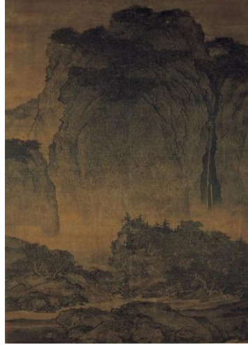
Görsel 1. Fan Kuan, Travelers Among Mountains and Streams, İpek üzerine mürekkep, 206.3x103.3cm (Visual 1. Fan Kuan, Travelers Among the Mountains and Streams, Ink on Silk, 206.3x103.3cm)

bırakacaklardır. Bu anlamda peyzaj, dinsel bir sanat biçimi haline gelmiştir.