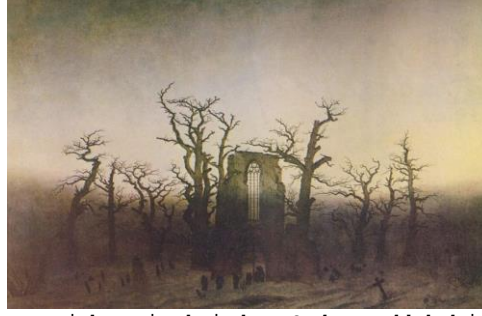
GörSEL 11. Caspar David Friedrich, Oakwood'daki Manastır, Meşe Ormanında Manastır, Tuval üzerine yağlıboya, 110x171cm (Visual 11. Caspar David Friedrich, Oakwood'daki Monastery, Monastery in Oak Forest, oil on canvas, 110x171cm)