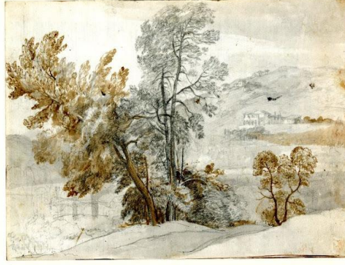
Görsel 3. Claude Lorrain, Trees, Kâğıt Üzerine Çizim (Visual 3. Claude Lorrain, Trees, Drawing on Paper)

Albrecht Altdorfer'in resimlerinde manzara resimlerinin / peyzajlarının egemen olduğu tablolarında dinsel öyküler, olaylar anlatılmıştır. Aşağıda verilen "The Battle of Alexander at Issus" isimli resminde, mavi dağların üzerinden kan kırmızı bulutlarla donmuş güneş ile soluk renklerle, gerçekdışı gizemli bir atmosfer verilmiştir (Görsel 4 ve Görsel 5). Sanatçı bu eserinde coşkunu, zengin ve mutluluk dolu bir üslup ortaya koymuştur. Formlar, çizgiler ve renkler zorlanmaksızın, akıcı bir şekilde yaşayan bir doğayı anlatmıştır. Sanatçının resimlerinde peyzaj çeşitli renklere bürünmüş, bitkilerle biraz daha canlandırılmıştır. Sanatçı, manzara resminin bir tür olarak kabul edilmediği bu dönemlerde erken bir manzara ressamı olarak dikkat çekmiştir (Eroğlu, 2007).