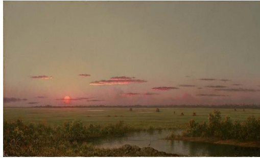
GörSEL 12. Martin Johnson Heade, Sunset on Long Beach tuval üzerine yağlıboya, 25.72x55.88cm (Visual 12. Martin Johnson Heade, Sunset on Long Beach oil on canvas, 25.72x55.88cm)