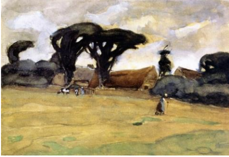
Görsel 14. Frederick C Frieseke, Dutch Landscape, Tuval üzerine yağlıboya, 45.72x30.48cm (Visual 14. Frederick C Frieseke, Dutch Landscape, oil on canvas, 45.72x30.48cm)

Frederick Frieseke'in resimleri buraya kadar bahsedilen sanatçıların çalışmalarına göre daha kaba, kütleli ve lekeli formları içinde barındırmaktadır (Görsel 14 ve Görsel 15). Toprağı sığınak olarak düşündüğümüzde yüce/süblim kavramının toprakta adeta bir güven içerisinde kendini gösterdiğine şahit oluruz. Bu duygunun ağırlığının formlardaki ağırlığa, kütleliliğe dönüşmesini ve ayrıntılardan sıyrılmasını bu sanatçının resimlerinde görebilmekteyiz. Soyut, süblim, ehlileşmemiş manzara resimlerini kendi özgünlüğü içerisinde veren sanatçı bu yönüyle diğer sanatçılardan ayrılmaktadır.