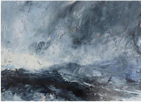
Görsel 20. Janette Kerr, Rain at Sea Shetland, kâğıt üzerine yağlıboya, 22x32cm (Visual 20. Janette Kerr, Rain at Sea Shetland, oil on paper, 22x32cm)

Manzara resimleri yapma fikri 20. yüzyılın kentli dünyasında da sanatçıların peşini bırakmamıştır. Bu durum sanatçıların hem söylemlerinde hem de resmetme süreçlerindeki uygulamalarında aynı şekilde gerçekleşmeye devam etmiştir. Günümüz sanatçılarından Janette Kerr de Turner gibi bir deniz ressamı olarak doğadaki süblim kavramını yerinde deneyimleyerek resmetmiştir. Bu sanatçıyı Turner'dan ayıran en önemli özelliği, resimlerini kayaların üzerinde, bazen bir teknede bazen de bir fırtınanın ortasında canlı olarak resmetmesidir. Kerr'in cesur, etkileyici, keşfedici, hızlı ve dinamik kalın boya katmanlarını içeren resimleri, bizlere denizin soğukluğunu ve dalgalardan taşan su damlalarının ıslaklığını kullandığı boya katmanlarının içerisine hapsederek lekelerde ve fırça vuruşlarında hissettirir. Resimlerin bu kadar etkili olması belki de boya ve kağıdındaki deniz tuzu, denizin havası ve fırtınanın şiddetini barındırıyor olmasından kaynaklanmaktadır (Görsel 20).