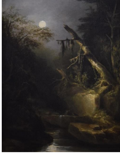
Görsel 9. George Loring Brown Midnight on the Okefenokee Swamp , tuval üzerine yağlıboya, 62x54cm (Visual 9. George Loring Brown on the Okefenokee Swamp , oil on canvas, 62x54cm)

Caspar David Friedrich'in resimlerinde varolan "yüce" kavramı; aslında kendi içerisinde ruhun ıssız ve yalnız duygulara dalarak kendini aynı anda hem huzur hem de korku ve endişeleriyle yüzyüze getirdiği karşıtlığıyla bizlere sunmuştur (Görsel 10 ve Görsel 11). Sanatçının resminde oluşan bu ruhsal karşıtlık, manzaralarında izleyiciye sunduğu kuşbakışı görünümü ile verilen gerilimli atmosferle sağlanmaktadır. Uçsuz bucaksız ortaya getirdiği bu manzara resimlerinde insansızlaşmış göz alabildiğine engin alanlarla ıssızlığın hem ruhsal hem de fiziksel anlamda algılanan gerçeği ile izleyiciyi karşı karşıya getirir. Nietzsche'ye göre "Doğa bize aldırmadığından doğanın ortasında kendimizi öyle rahat hissederiz ki" (1997:36) bu şekilde aslında enginlik bizlerin bir düşünme sığınağıdır.