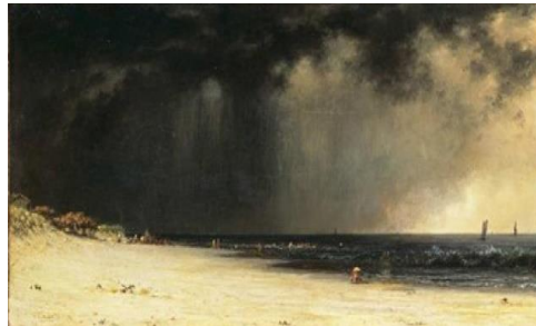
GörSEL 13. Martin Johnson Heade, Landscape, tuval üzerine yağlıboya, 24.27x54.66cm (Visual 13. Martin Johnson Heade, Landscape, oil on canvas, 24.27x54.66cm)