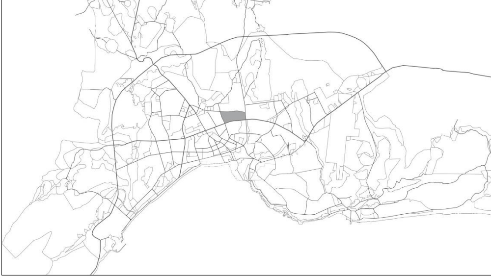
Şekil 1. Karşıyaka Mahallesi'nin kent bütünündeki konumu (Figure 1. Location of Karşıyaka Town in the city)

kent merkezine yakınlığı nedeniyle toplumsal ve mekânsal açıdan değişim dinamikleriyle karşı karşıya kalmış olmasıdır. Mahalle 1960'lı yıllarda kırsal göçmenin kente tutunma mücadelesine tanık olurken, 1980 sonrasında farklı aktörlerin buradaki topraklar üzerinden rant elde etme çabasına sahne olmuştur.