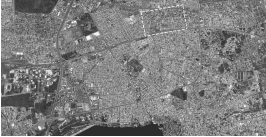
Şekil 2. 2015 yılına ait uydu fotoğrafında Karşıyaka Mahallesi'nin dokusu (Figure 2. Texture of Karşıyaka Town with satellite pictures from 2015)