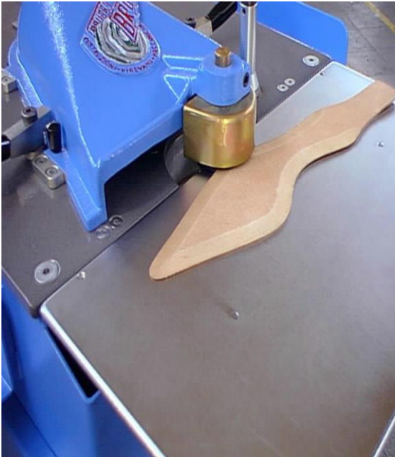
a. Yarı İşlenmiş frezeli taban (Semi finished shoe sole)

Ayakkabı tabanlarına gerek mekaniksel özelliklerini artırıcı gerekse maliyeti azaltmak maksatlı ve proses işlemlerini kolaylaştırmak için dolgu malzemeleri kullanılmaktadır. Hazır kauçuk tabanlarda olması gereken mekaniksel özellikler TS 5499, TS 4698 ve TS 5501 de verilmiştir. Tablo 2’de TS 5499 ye göre elastomer esaslı ayakkabı topukları ve tabanlar için istenilen özellik değerleri verilmiştir. Hazır kauçuk tabanlar tip 1 ve tip 2 diye iki grupta incelenmektedir. Üretim bakımından aralarında bir fark bulunmamaktadır.