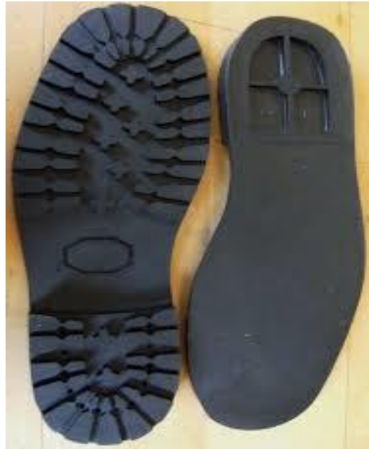
b. Hazır havuzlu taban (Ready shoe sole)