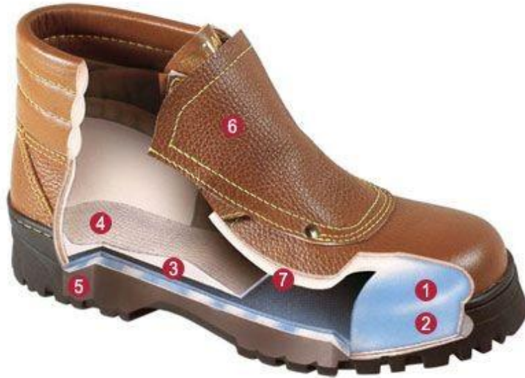
Şekil 1. Ayakkabının belli başlı parçaları; 1. Bombe 2. Yüz 3. Taban astarı 4. Mostra 5. Dış taban 6. Dil ve 7. İç astar (Figure 1. Main parts of shoe; 1. Toepuff 2. Upper 3. Insole 4. Insock 5. Outer sole 6. Tongue and 7. Inner liner)

Çorap dışında ayağa giyilen her türlü giyecek ayakkabı olarak tanımlanmaktadır. Ayakkabı en önemli insan giyeceklerinden biridir. Ülkemizde kişi başına 2,7 çift ayakkabı düşmekte iken bu oran Avrupa Birliği ülkelerinde ortalama 7 çifttir. Bazı gelişmiş ülkelerde kişi başına 20 çift ayakkabı düşmektedir. Ayakkabı imalinde metal, tekstil, doğal deri, suni deri, elastomer vb çok farklı malzemeler kullanılmaktadır. Ayakkabılar belli başlı iki ana parçadan oluşur. Bunlar, ayakkabının saya denilen üst kısmı ve yerle temas eden taban kısmıdır. Şekil 1'de bir ayakkabıyı kesitinde ayakkabıyı oluşturan parçaların bazıları görülmektedir. Ayakkabılar daha çok ayağı dış şartlardan koruma amaçlı olarak giyilir [1].