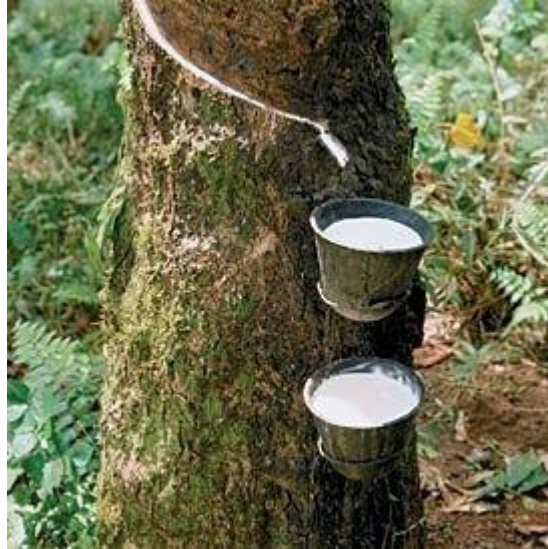
Şekil 2. Kauçuk ağacından lateks elde etmek (Figure 2. Extracting latex from rubber tree)