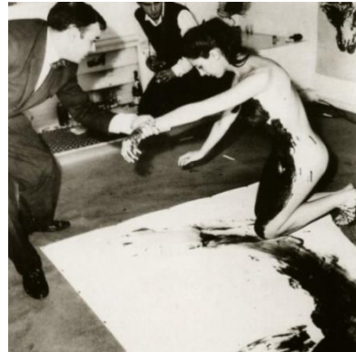
Fotoğraf 2. Yves Klein, 1960, Anthropometries'in mavi dönemi (Photo 2. Yves Klein, 1960, blue period of the Anthropometries)

Kavramsal sanatın açtığı olanaklar doğrultusunda gelişen hareketler, türler bedene estetik bir yaklaşım yerine artık bireysel ve toplumsal bir varlık olarak bakmıştır. Özellikle de en çok 'Vücut Sanatı' ve 'Performans Sanatı' bedeni kullanmıştır. Germaner, "1960 Sonrası Sanat" adlı kitabında bedeninin Vücut Sanatı'nda kullanım biçimi için şunları söyler: