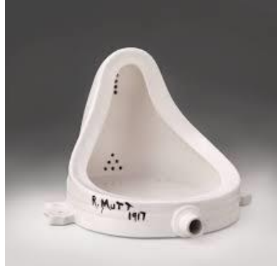
Fotoğraf 1. Marcel Duchamp "Çeşme", porselen, 1917 (Photo 1. Marcel Duchamp "Fountain", porcelain, 1917)

doğurmuştur (Fotoğraf 1 ve Fotoğraf 2). Sanatçıların beden algısı 'beden-model' değildir. Artık yapıtın içinde yer alan sanatçı, bilinç düzeyinde özne olurken yapıtının da nesnesi konumundadır. Beden ister nesne ister özne konumunda olsun, sanatın hazır malzemesi olduğu için her şekilde kullanılmıştır. "Yapıtın merkezinde yer alan ya da herhangi bir şekilde dil olarak kullanılan beden, gösterge dizgesi içerisinde gösteren olarak anlam kazanır. Ancak beden üzerine yoğunlaşan sanatçıların düşüncesi gösteren olma amacını taşımaz. Onların amacı "modernitenin oluşturduğu merkezi otoritenin yetkisinde tuttuğu bedeni ondan geriye alma ve sadece ona sahip olan öznenin ona hükmedebilmesini sağlamaktır" (Kahraman, 2005:33).