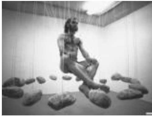
Fotoğraf 4. Stelarc, 1980, taş eylemi, asılma (Photo 4. Stelarc, 1980, stone action, hanging)

beden üzerinde değişiklik yapabilmenin özgürlüğü söz konusudur. Soru, toplumun insanlara ifade özgürlüğü tanıyıp tanımayacağı üzerine değil, insan türünün bireyleri alternatif gen kodlamaları gerçekleştirmekte serbest bırakıp bırakmayacağı üzerine sorulmalıdır” (Stelarc, 1999:32-34). Tıbbın tüm olanaklarını kullanarak bedenini yeniden yapılandıran Orlan da yaptığı sanatı ‘Carnal Art’ olarak nitelendirir. Hazır bedenini-hazır malzemeyi yontarak ideal güzelliğe ulaşmayı hedeflemiştir. Günümüzde yapılan estetik ameliyatlara, yağ aldirmalar, botokslar, lazer uygulamaları Orlan’ın otuz yıl kadar önce işaret ettiği erkek merkezli estetik anlayışı haline dönüşmüştür. Sanatçı, bu güzellik sevdasına o dönemde çok radikal bir tavırla yaklaşır; erkek bakışlı estetik değerleri, kadında aranan ideal güzelliği, geçirdiği bir dizi estetik operasyonla reddeder (Fotoğraf 5). Başyapıtlarda yer alan ideal kadınların, güzellik standartlarını ameliyatla kendi yüzüne ve vücuduna uygulatır. Kendisini seyredilen ve arzu edilen bir ideal güzel olarak yeniden sunar.