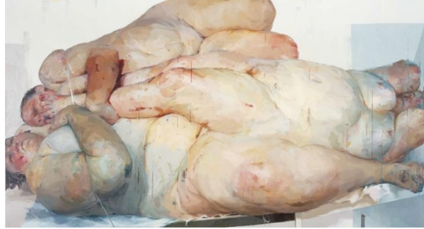
Fotoğraf 8. Jenny Saville, 1999, dayanma noktası, T.Ü.Y.B. 261.6x487.7cm (Photo 8. Jenny Saville, 1999, the resting point, T.Ü.Y.B. 261.6x487.7cm)

Vücut ve performans sanatı bedeni anlatmakta en iyi yoldur ancak günümüze yaklaşırken sanatçılar yeniden keşfeder gibi geleneksel resim yapma yolundan da vazgeçmediler. Her ne kadar teknoloji odaklı işler yapılsa da geleneksel teknikler de unutulmamıştır. Yağlı boya tekniğinden vazgeçmeyen bir sanatçı olan Jenny Saville, beden kavramını tüketilen bir nesne olarak irdelemiştir. Resimlerinde iri bedenler kullanan Saville, modellerini bir et yığını gibi göstererek güzellik algısına meydan okumuştur (Fotoğraf 8).