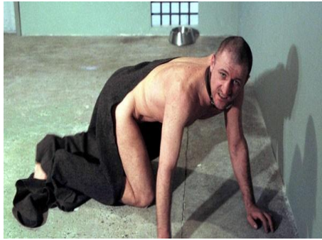
Fotoğraf 3. Oleg Kulik, 1997, Amerika Beni Isırır, Ben de Amerika'yı, performans (Photo 3. Oleg Kulik, 1997, America Bites Me, I am America, performance)

Teknoloji, bilim ve tıp yoluyla bedenleri üzerinde sınırları zorlayan sanatçılar, insanın varoluşuna meydan okumuşlardır. Örneğin Stelarc, bir ucuna ağırlık olarak taşın bağlandığı diğer ucuna ise kancalarla kendi bedenini astırdığı işi için teknolojinin insanı ele geçirdiğini söyler (Fotoğraf 4). 'Süspansiyon Performansı' adlı işinde internet üzerinden herhangi bir yerden gönderilen sinyallerle kancaların takılı olduğu yerleri hareket ettiren bir sistem geliştirmiştir ve sanatçı ile izleyici arasındaki iletişim farklı bir boyut kazanmıştır. Sanatçı bedenini kontrol altına alan bu teknoloji hakkında şunları söylemiştir: "Bedeni, ruhsal ya da toplumsal bir yapı olarak görmek de anlamını yitirmiştir. Beden, denetlenir, değiştirilebilir bir yapıdır ve özne olarak değil, yeniden biçimlendirmenin nesnesi olarak ele alınmalıdır. İçinde bulunduğumuz "information overload" çağında artık düşüncenin değil, biçimin, yani