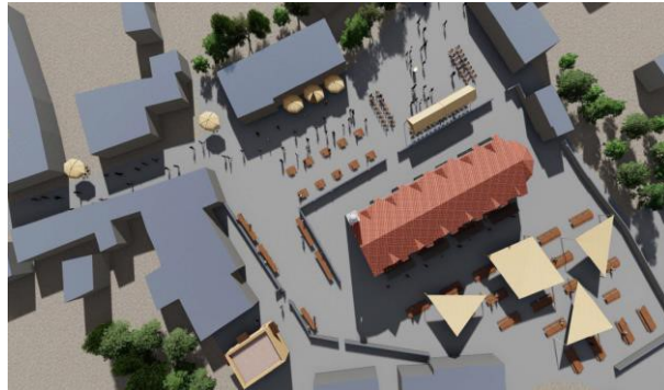
(Ayios Yergios kilisesi ve etkinlik alanı) Çizim 3. Ayios Yeorgios kilisesi ve çevresi (Alan 2) (Drawing 3. Ayios Yeorgios church surroundings, Area 2)

Kilise arkasındaki alanda ise özellikle tanıtım, el sanatları, özel aktivite vb. standlar yer almaktadır. Bu alanda ayrıca oturma alanlarının sayısı artırılmış ve gölgelik sistemler kullanılmıştır.