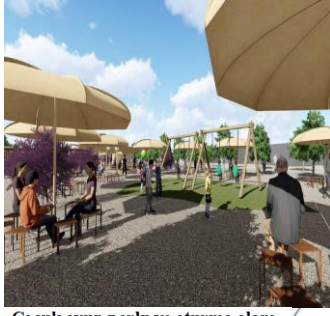
Çocuk oyun parkı ve oturma alanı