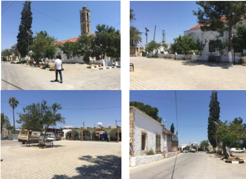
Resim 4. Ayios Yeorgios kilisesi ve çevresi (Güner, A., Arşivi, 2018) (Photo 4. Ayios Yeorgios church surroundings, (Güner, A., Archive, 2018))

Alan 2: Projede Ayios Yeorgios kilisesi ve çevresinin (alan 2) eko festival ana etkinlik alanı olarak kullanımının devam etmesi talep edildiğinden halk dansları, tiyatro gösterisi vb. Kıbrıs kültürüne ait etkinliklerin sunulacağı 200 kişilik etkinlik sahnesinin festival günü geçici olarak bu alanda kurulmasına karar verilmiştir. Kadın el sanatları atölyesi olarak kullanılan kilise çevresindeki zemin kaplaması parke taşı olarak düşünülmüş ve bu alanda ziyaretçilerin bir Kıbrıs geleneği olan buhurdanlık ile karşılanması öngörülmüştür (Resim 4) (Çizim 3).