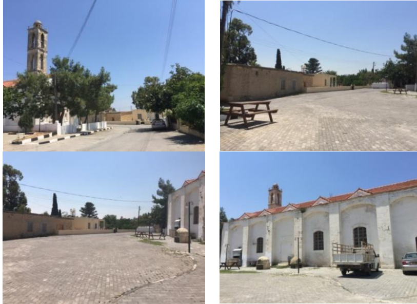
Resim 5. Ayios Yeorgios kilisesi ve çevresi (Güner, A., Arşivi, 2018) (Photo 5. Ayios Yeorgios church surroundings, (Güner, A., Archive, 2018))

Alana yakın bir adet wc (kadın, erkek, engelli) ve alan girişinde acil durumlar için bir ambulans kullanımı düşünülmüştür (Resim 5) (Çizim 4).