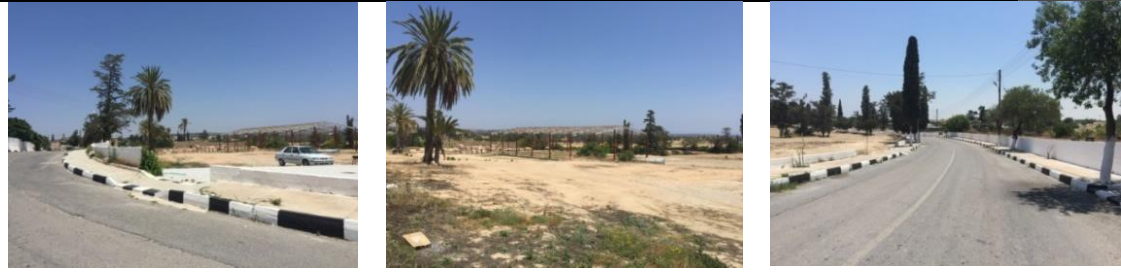
Resim 3. Büyükkonuk eko festival alan girişi (Photo 3.The entry of Buyukkonuk eco festival area)

Alan 2: Projede Ayios Yeorgios kilisesi ve çevresinin (alan 2) eko festival ana etkinlik alanı olarak kullanımının devam etmesi talep edildiğinden halk dansları, tiyatro gösterisi vb. Kıbrıs kültürüne ait etkinliklerin sunulacağı 200 kişilik etkinlik sahnesinin festival günü geçici olarak bu alanda kurulmasına karar verilmiştir. Kadın el sanatları atölyesi olarak kullanılan kilise çevresindeki zemin kaplaması parke taşı olarak düşünülmüş ve bu alanda ziyaretçilerin bir Kıbrıs geleneği olan buhurdanlık ile karşılanması öngörülmüştür (Resim 4) (Çizim 3).