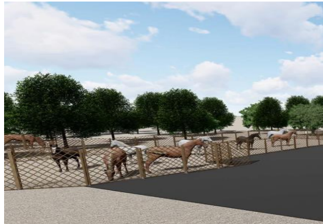
(Çocuklar için etkinlik alanı)