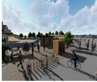
Kerpiç otobüs durağı ve bisiklet park alanı