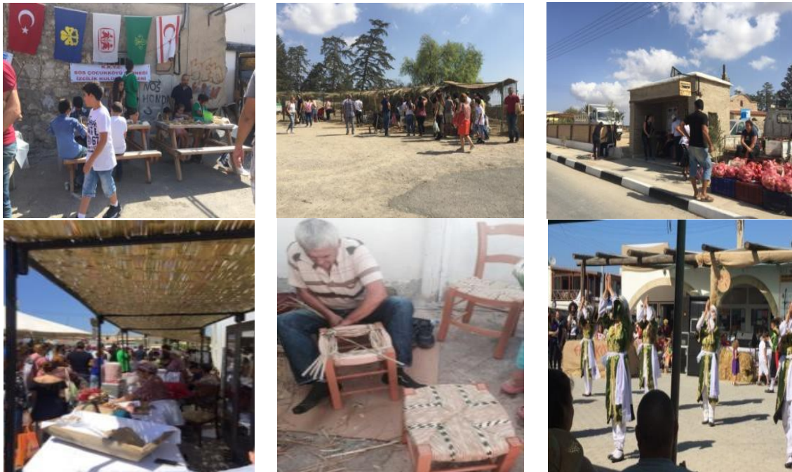
Resim 1. Büyükkonuk eko festival alanı (Photo 1. Buyukkonuk eco festival area)

Kıbrıs kültürünün festival havasında tanıtılması, paylaşılması ve gelecek nesillere aktarılması açısından çok önemli bir etkinlik olan Büyükkonuk eko festivalinde, her yıl artan ziyaretçi sayısına bağlı olarak festival alanı ve çevresinde yeni bir düzenleme gereksinimi oluşmuştur. 2016 yılında mimarlık eğitimi sürecine mesleki pratik çalışmayı entegre etmek amacı ile İstanbul Medipol Üniversitesi, Güzel Sanatlar Tasarım ve Mimarlık Fakültesi ile Büyükkonuk Belediyesi arasında imzalanan protokol çerçevesinde Büyükkonuk belediyesi tarafından eko festival alanına yönelik bir çevre düzenleme projesi talep edilmiştir. Bu doğrultuda 2017-2018 eğitim öğretim yılında mimarlık, iç mimarlık ve çevre tasarımı bölümleri öğretim üyeleri yönetiminde 3.sınıf öğrencilerinden bir çalışma grubu oluşturulmuştur. Çalışma grubunda yer alan öğretim üyelerinin ve bazı katılımcıların 2016 yılında Büyükkonuk'da "tasarla-yap" atölye çalışması kapsamında tamamladıkları kerpiç otobüs durağı deneyimi bu proje için önemli bir ön çalışma olmuştur. Eko festival alanı ve çevre düzenleme projesi için öncelikle çalışma grubu alanda incelemelerde bulunmuş, festival alanına ulaşım, özellikle eko festival günü ziyaretçilerin yoğun olduğu saatlerde alan kullanımları, yaya akışı, yapılan etkinlikler, stand tipleri ve kullanımları vb. konular belirlenmiştir (Resim 1).