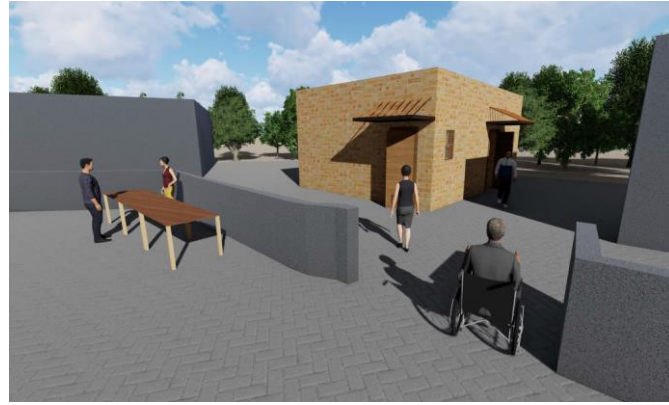
(wc (kadın, erkek, engelli))