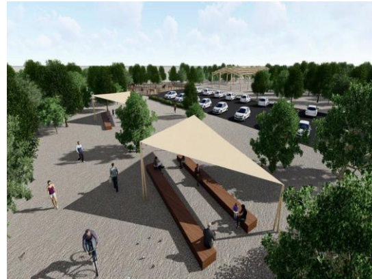
(Gölgelik sistemli oturma alanları)