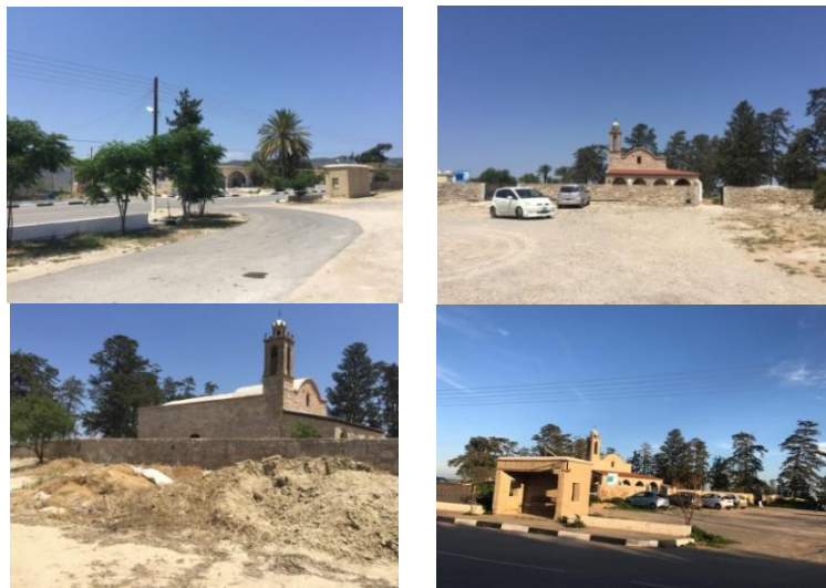
Resim 6. Ayios Afksentios kilisesi önu (Güner, A., Arşivi, 2018) (Photo 6. The front of Ayios Afksentios church, (Güner, A., Archive, 2018))

Alan 3: Ayios Afksentios kilisesi ve önündeki açık alanda (alan 3) festival günü geçici olarak kurulacak olan pişirme-servis üniteleri ve bu üniteleri çevreleyen oturma alanları ziyaretçilerin kullanımına sunulmuştur. Alanda çocuklar için bir oyun alanı öngörülmüştür. Oyun alanı çevresindeki oturma alanları gölgelik sistemleri ile ebeveynlere çocuklarını izleme imkânı tanımaktadır. Bu alanda ayrıca 2016 yılında "tasarla-yap" atölye çalışması kapsamında yapımı tamamlanan ve kullanıma açılan kerpiç otobüs durağı yer almaktadır. Kerpiç otobüs durağı yanında bir bisiklet park alanı ve alanda bir adet wc (kadın, erkek, engelli) kullanımı da düşünülmüştür (Resim 6) (Çizim 5).