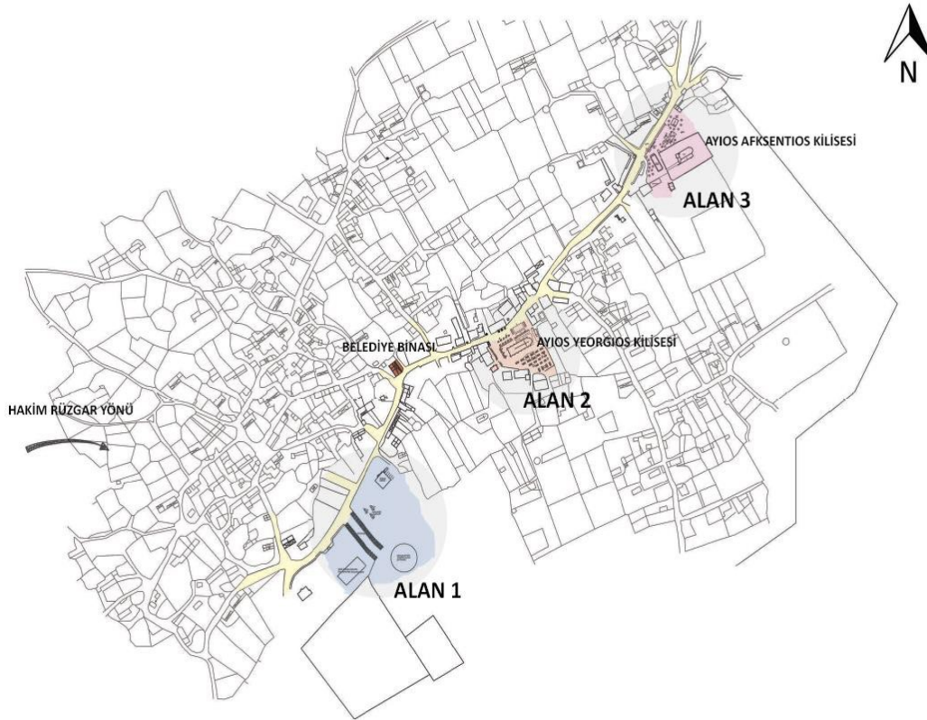
Çizim 1. Büyükkonuk eko festival alan krokisi (Drawing 1. Büyükkonuk eco festival area plan)

Proje kapsamında festival alanının (alan 1, alan 2, alan 3) yerleşim planları (ö:1/500, ö:1/200, ö:1/100), ahşap hareketli pişirme-servis üniteleri ve kerpiç wc mekânlarının (kadın, erkek, engelli) uygulama projeleri (ö:1/50), planlar, kesitler, görünüşler, 3 boyutlu görseller, detaylar (ö:1/10, ö:1/5) vb. hazırlanmıştır. Kıbrıs'da gerçekleşen programda ayrıca Büyükkonuk'da geleneksel mimari dokunun (kerpiç ve kesme kumtaşlı, kemerli revaklı, avlulu, tek katlı geleneksel yapılar) korunması için festival alanı cephe silüetleri çalışılmıştır. Projede eko festival alanı 3 bölgeye ayrılmıştır. 1. bölge (alan 1) eko festival alanına giriş, 2. Bölge (alan 2) eko festival ana etkinlik alanı olan Ayios Yeorgios kilisesi ve çevresi, 3. bölge (alan 3) ise eko festivalin bittiği Ayios Afksentios kilisesi önü olarak belirlenmiştir (Çizim 1).