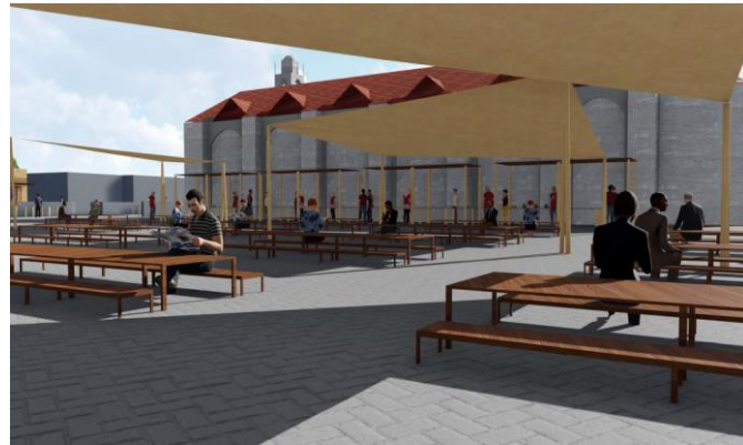
Çizim 4. Ayios Yeorgios kilisesi, el sanatları standları, oturma alanları (Alan 2) (Drawing 4. Ayios Yeorgios church, handicrafts stands, seating areas, Area 2)