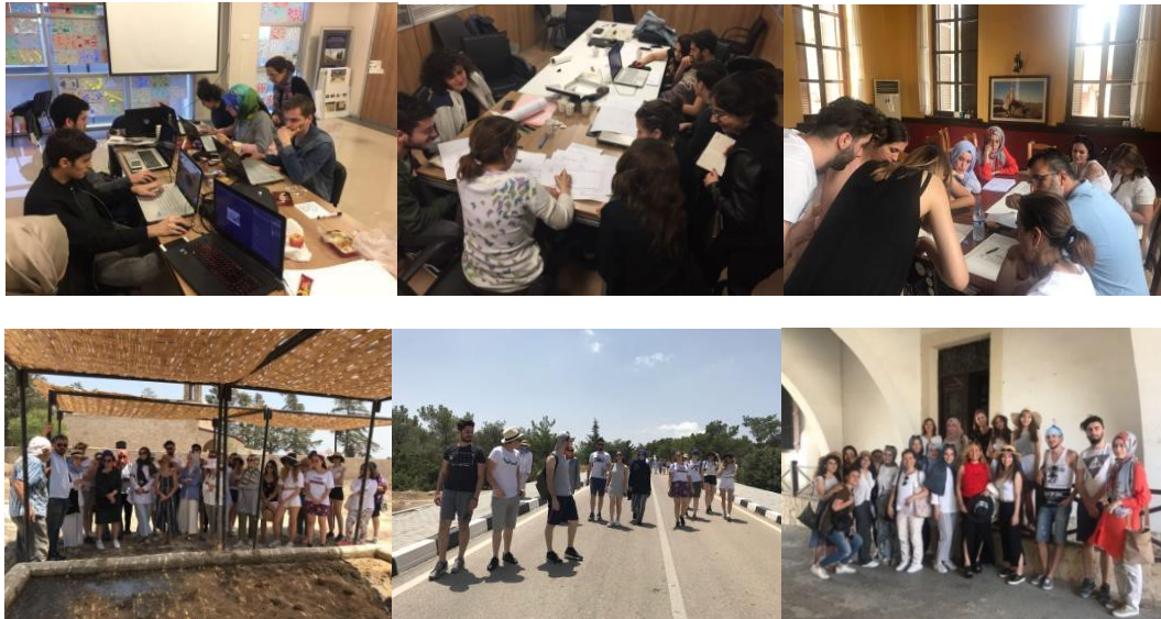
Resim 2. Çalışma grubu, İstanbul ve Kıbrıs (Güner, A., Arşivi, 2018) (Photo 2. Working group, Istanbul and Cyprus, (Güner, A., Archive, 2018))