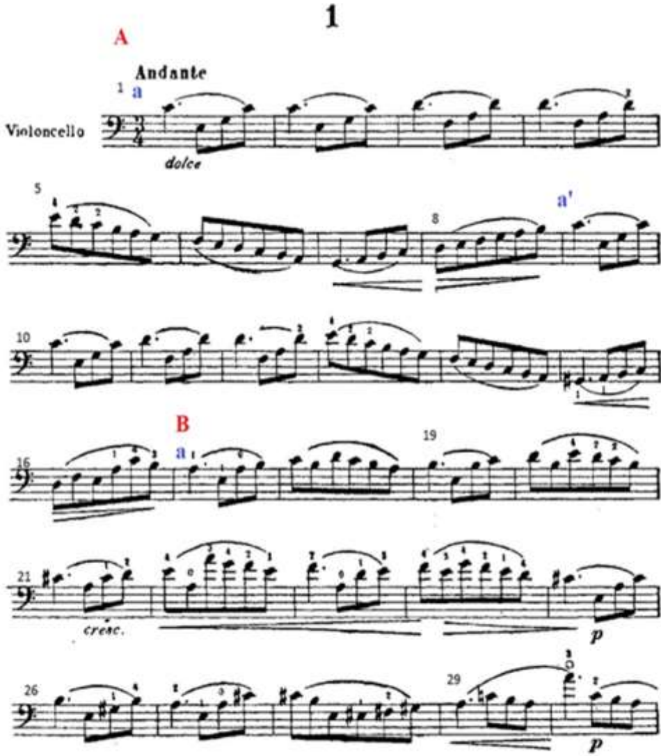
Şekil 1. Resim (Figure 1. Image)