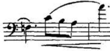
Şekil 6. Resim (Figure 6. Image)

Teknik Özellikleri: Etütte bu figürden toplam 16 ölçü bulunmaktadır. Etüdün %22'sini oluşturan bu figür, 5-6-8-13-14-16-18-20-22-24-28-35-45-52-53-55. ölçülerde karşımıza çıkar. Figürün bulunduğu her ölçü tek baş içerisinde yazılmıştır. Figür, inici ve çıkıcı ses dizileri olarak yazıldığı gibi, notalar arasında atlamalar kullanılarak da oluşturulmuştur. Figür 6, etüdün tamamında, figür 4'ün bittiği sesin bir üst sesinden başlamaktadır. 3/4 'lük ölçüde Do Majör ve Re minör gam ve arpej çalışmaları yapılabilir. Dizi seslerinin temizliğini sağlamak için, boş tellerle ilişkilendirme yapılması önerilir.