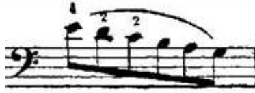
Şekil 5. Resim (Figure 5. Image)

Teknik Özellikleri: Etütte bu figürden toplam 16 ölçü bulunmaktadır. Etüdün %22'sini oluşturan bu figür, 5-6-8-13-14-16-18-20-22-24-28-35-45-52-53-55. ölçülerde karşımıza çıkar. Figürün bulunduğu her ölçü tek baş içerisinde yazılmıştır. Figür, inici ve çıkıcı ses dizileri olarak yazıldığı gibi, notalar arasında atlamalar kullanılarak da oluşturulmuştur. Figür 6, etüdün tamamında, figür 4'ün bittiği sesin bir üst sesinden başlamaktadır. 3/4 'lük ölçüde Do Majör ve Re minör gam ve arpej çalışmaları yapılabilir. Dizi seslerinin temizliğini sağlamak için, boş tellerle ilişkilendirme yapılması önerilir.