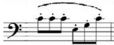
Şekil 4. Resim (Figure 4. Image)

Teknik Özellikleri: Etütte bu ölçüdeki figürden 40 adet bulunmaktadır. Etüt genelinde en çok yüzdeye sahip olan figürdür. Figür, noktalı dörtlük ve üç tane sekizlik notanın bir bağ içerisinde yazımından oluşur. Bu figür etüdün %56'sını oluşturmaktadır. Figürün bulunduğu ölçü numaraları; 1-2-3-4-7-9-10-11-12-15-17-19-21-23-25-26-27-36-37-38-39-40-41-48-49-50-51-54-56-57-58-59-60-61-62-63-64-65-66-67'dir. 15-17-19-21-23-54-58-59-63. ölçüler dışında bu figür uzun ses ve arpej olarak yazılmıştır. Figürün bulunduğu her ölçü tek bağ içerisinde yazılmıştır. Etütte, ritim gruplarının yazılışı sebebiyle 3/4 'lük ölçünün 6/8'lik ölçü olarak algılanmaması için, çalışmaya başlamadan önce etüdün 3/4'lük olduğu düşünülüp, ilk iki ölçünün bu düşünceyle solfejinin yapılması önerilir. Bütün yayda 6 tane sekizlik notayı eşit duyurmak için, yayın tamamını altı eşit parçaya bölerek "bağlı staccato" çalışması yapılabilir.