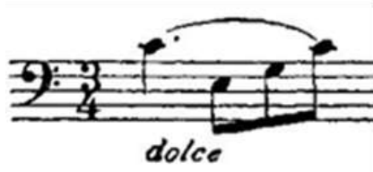
Şekil 7. Resim (Figure 7. Image)

Aşağıda Sebastian Lee Op. 113 1 numaralı Do majör etütün incelenmesi ile elde edilen sonuçlar yer almaktadır: