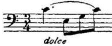
Şekil 3. Etüt no: 1, 1. Ölçü (Figure 3. Etude no: 1, 1. Measure)

S.Lee Op.113 nolu metodun 1 numaralı etüdü (Şekil 3-4-5-6) ölçü bazında incelenmiştir.