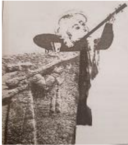
Şekil 1. Hitit telli çalgı kabartma ve minyatür (1582) (Figure 1. Hittite stringed instrument relief and miniature, (Sarı, 2012:57))

Tanbur çalgısının tarihi hakkında çeşitli araştırmalar mevcuttur. Bu araştırmalar tanburun yaklaşık dört bin yıllık bir geçmişi olduğunu göstermektedir. Bugüne kadar yapılan araştırmalar içinde bize en eski bilgiyi veren, The Music of the Sumerian adlı eseriyle, İngiliz bilgini Francis W. Galpin olmuştur. Türk Makam Müziğinin önemli bilim adamlarından Hüseyin Saadettin Arel bu bilgiyi, Musiki Mecmuasında yazdığı makalesinde şöyle ifade etmiştir: Adı geçen İngilizce kitabın 50. Sayfası karşısında Milat'dan takriben 1600 yıl öncesinden kalmış bir sınır taşının fotoğrafı var. Bu taşın üzerinde tanbur çalan iki adamın kabartma resimleri görülüyor (Aksüt, 1994:11). Bugün Kırgızlar ve Kalmuklar'da kullanılan, önceleri tek, daha sonra iki telli olan bu çalgı, zaman içinde değişikliğe uğrayarak, çeşitli türleri ortaya çıkmıştır. Bunlar gerek sapın kısaltılması gerek tını kutusunun büyütülüp küçültülmesi, gerekse tellerin değiştirilmesiyle oluşturulmuşlardır (Sarı, 2012:57). Bahse konu çalgılar, çeşitli kaynaklarda tanbur çalgısının ilkel şekli olarak kabul edilmektedir. Ud, kopuz, çöğür ve gitar gibi çalgıların ise ilkel tanburdan esinlenerek yapılmış çalgılar olduğu belirtilmektedir. Mısır, Eti, Mezopotamya medeniyetlerinin kabartma resimlerinde ve minyatürlerinde tanbur çalgısına rastlanmaktadır.