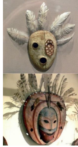
Görsel 6. Şaman maskeleri [30] (Image 6. Shaman Masks)

Şaman törenlerinde esrime esnasında Şaman'ın üzerinde kuş, geyik, ayı gibi hayvanların simgeleri olan kıyafetler bulunur. Şaman'ın esrime halindeyken başka dünyalara giderek oradaki ruhlarla konuştuğuna inanılır [17]. Kuş imgesi, Şaman'ın insanların dünyası ile ruhlar dünyası arasında yaptığı yolculuğa aracılık edendir. Tören yapılırken Şaman'ın başında, üzerinde kuş tüylerinin bulunduğu bir başlık ya da yüzünde, kuşları çağrıştıran bir maske olabilmektedir (Görsel 5-6). Kuş imgesi Anadolu'da, halk edebiyatı, el sanatları, halk oyunları ve halk türküleri gibi kültürel unsurlar içinde de sık kullanılan bir imge olmuştur. Edebi eserlerde sevgiliye dair göndermeler içeren bu imge; çorap, halı, kilim gibi el işçiliği gerektiren uğraşlarda sözel olarak ifade edilemeyen görsel biçimleri olarak karşımıza çıkmaktadır (Görsel 7-8).