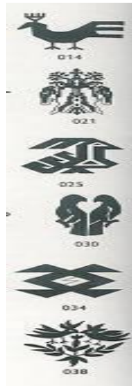
Görsel 7. Kuş Motiflerinden örnekler [21] (Image 7. Examples of Bird Motifs)

Şaman törenlerinde esrime esnasında Şaman'ın üzerinde kuş, geyik, ayı gibi hayvanların simgeleri olan kıyafetler bulunur. Şaman'ın esrime halindeyken başka dünyalara giderek oradaki ruhlarla konuştuğuna inanılır [17]. Kuş imgesi, Şaman'ın insanların dünyası ile ruhlar dünyası arasında yaptığı yolculuğa aracılık edendir. Tören yapılırken Şaman'ın başında, üzerinde kuş tüylerinin bulunduğu bir başlık ya da yüzünde, kuşları çağrıştıran bir maske olabilmektedir (Görsel 5-6). Kuş imgesi Anadolu'da, halk edebiyatı, el sanatları, halk oyunları ve halk türküleri gibi kültürel unsurlar içinde de sık kullanılan bir imge olmuştur. Edebi eserlerde sevgiliye dair göndermeler içeren bu imge; çorap, halı, kilim gibi el işçiliği gerektiren uğraşlarda sözel olarak ifade edilemeyen görsel biçimleri olarak karşımıza çıkmaktadır (Görsel 7-8).