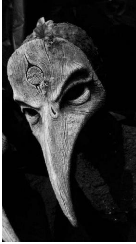
Görsel 5. Şaman maskesi [31] (Image 5. Shaman Mask)

Ölümler yırtıcı kuşlar tarafından yenir, kalan kemikler yaklaşık bir yıl güneşte bekletildikten sonra kireç odalarına kaldırılırdı. Kurutulan kemikler ezilerek doğaya bırakılırdı.