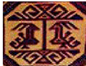
Görsel 8. Kilim Motifleri [20] (Image 8. Rug Motifs)