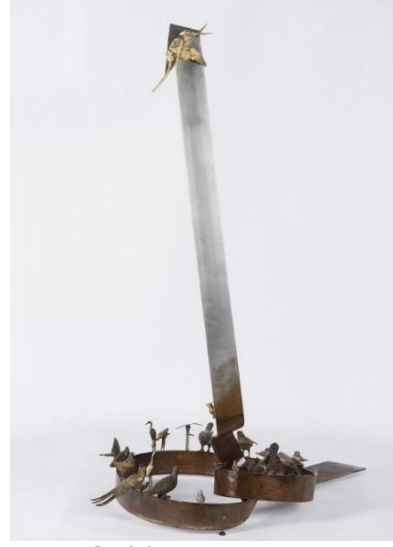
Görsel 14. Murat Morova, Kuşların Konferansı, 185x76x112, Demir, Pirinç, Gümüş kaplama ve Çinko, 2016 [23]

(Image 14. Murat Morova, Conference of Birds, 185x76x112, Iron, Brass, Silver plated, and Zinc, 2016)