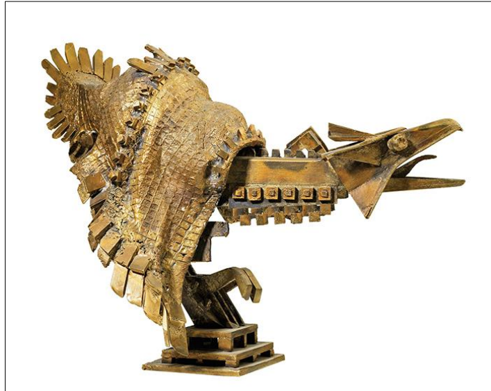
Görsel 17. Ali Teoman Germaner, Zümrüd-ü Anka, 31x30x43, Bronz, 2005 [9] (Image 17. Ali Teoman Germaner, Phoenix, 31x30x43, Bronze, 2005)