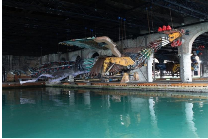
Görsel 15. Hu Bing, Phoenix, Düzenleme, 56. Venedik Bienali, 2015 [18] (Image 15. Hu Bing, Phoenix, Arrangement, 56. Venice Biennial, 2015)