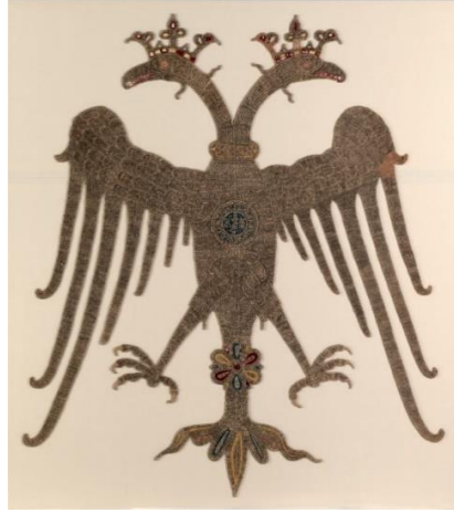
Görsel 2. Bizans. Çift Başlı Kartal, 148.6x129.9cm, İpek Kumaş Üzerine İşleme, 14. yy. Metropolitan Sanat Müzesi, New York, Amerika [2]

(Image 2. Byzantine. Double Headed Eagle, 148.6x129.9cm, Silk-Embroidery, 14. yy. The Metropolitan Museum of Art, New York, America)