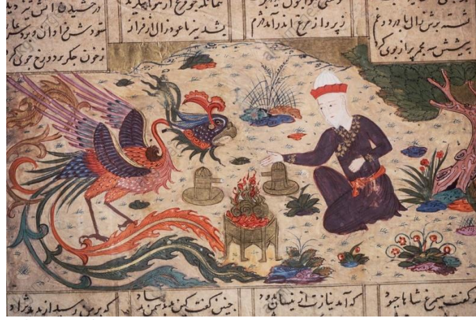
Görsel 12. Firdevsi, Şahname'den Elyazması, Prens Zal ve Simurg, Minyatürden Detay, Kağıt Üzerine Guaj, 1458, Hindistan Ulusal Müzesi, Yeni Delhi, Hindistan [6]

yaratım sürecini tetikleyen güçlü metaforlar mevcuttur. Bir kuş imgesi olan Simurg da bunlardan biridir.