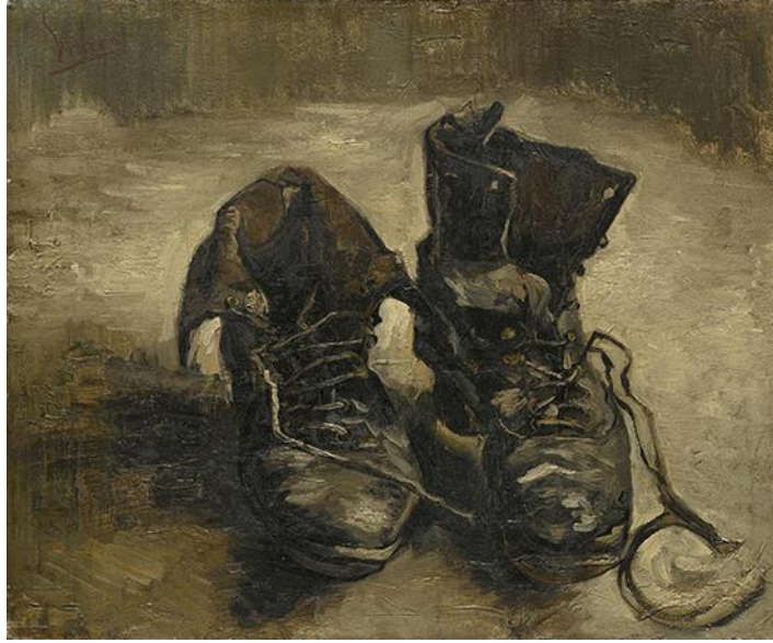
Görsel 1. Van Gogh, Bir Çift Ayakkabı, 38.1x48.3cm, Tuval Üzerine Yağlı Boya, 1886, Van Gogh Müzesi, Amsterdam, Hollanda [13] (Image 1. Van Gogh, A Pair of Shoes, 38.1x48.3cm, Oil on Canvas, 1886, Van Gogh Museum, Amsterdam, The Netherlands)

bugünün insanını bilinçli ve özgür bir birey olmaktan ziyade çağının gönüllü kölesi olarak tanımlasa da Sartre'a göre, 'bigeliğe ulaşma' yolunu aralayan özgünlük arayışındaki bireyin kendisini yeniden tasarlamasıdır.