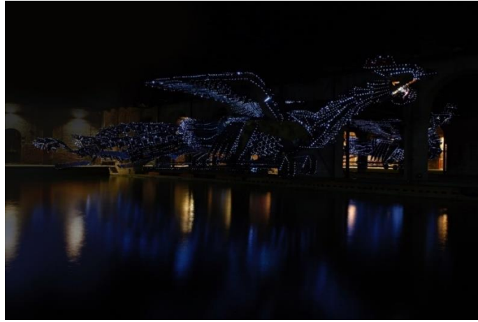
Görsel 16. Hu Bing, Phoenix, Düzenleme, 56. Venedik Bienali, 2015 [18] (Image 16. Hu Bing, Phoenix, Arrangement, 56. Venice Biennial, 2015)