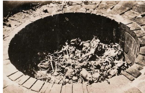
Görsel 4. Sessizlik Kulesi, İran [28]