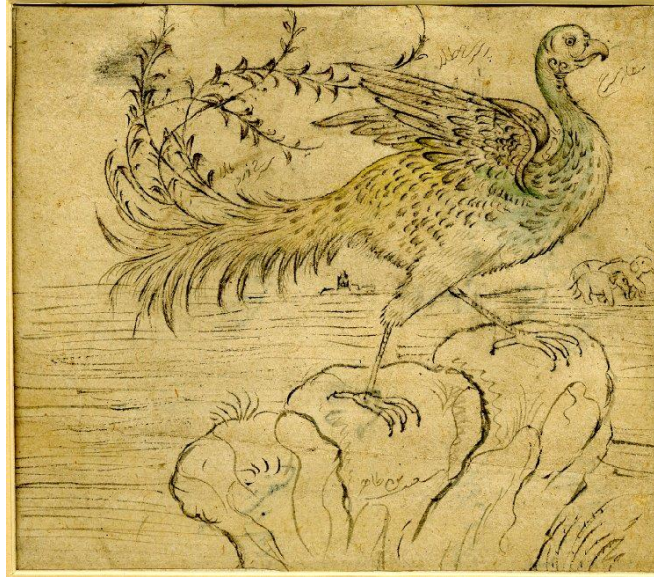
Görsel 11. Simurg ya da Anka Eskizi, Kağıt Üzerine Renkli Çizim, Anonim, 18.yy, İngiliz Müzesi Koleksiyonu, Londra, İngiltere [29] (Image 11. A Sketch with Colour of Simurgh or Persian Phoenix, Anonymous, 18.th century, British Museum Collection, Londra, England)

Yeryüzünde pek çok kuş çeşidi olduğu bilinmektedir. Her kuşun rengi, büyüklüğü, gaga yapısı, pençesi, kanatları ya da karakteristik özelliği birbirinden çok farklıdır. Attar'ın yaratmış olduğu Simurg imgesi serçe ya da bülbül gibi daha küçük ve naif çağrışımlar yapan bir kuştan ziyade kartal ya da şahin gibi daha büyük ve yırtıcı kuşları çağrıştırır. Bunu tercih etmesi Simurg'un kuşların padişahı olması nedeniyle midir yoksa karşısına çıkabilecek zorluklarla mücadele edecek olan kuşun daha güçlü bir anatomik yapıya sahip olması gerektiğini düşündüğü için midir bilinmez ama yaratılan Simurg imgesi devasa büyüklükte, yırtıcı bir kuştur. Sanat tarihsel süreçte betimlenen Simurg figürleri de çoğunlukla bu anlayışla yorumlanmıştır (Görsel 11). Uzun kuyruğu, devasa kanatları, keskin pençeleri, sivri gagası ve keskin bakışları ile adeta avını bekleyen bir kartalı andırır.