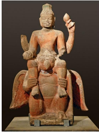
Görsel 9. Garuda'ya binmiş Vişnu heykeli, Cham Kültürü, Vietnam, 8-9. yy., Guimet Müzesi, Paris [8]

metaforik imgeler ise Tanrıya ulaşma yolunda kamil insana dönüşme araçlarını ifade eder. Kamil insan da Simurg gibi bilgelikle ilişkilendirilmiştir. Fars mitolojisinde Simurg adıyla bilinen bu efsanevi kuş pek çok kültürde farklı isimlerle karşımıza çıkmaktadır. Bilinen ilk örneği, Eski Mısır'da ateş kuşu olarak geçen Feniks'tir. Feniks'in Batı mitolojisindeki karşılığı fonetik olarak da Fenikse çok benzeyen Phoenix'tir [10]. İslam mitolojisinde Anka, Türklerin İslamiyet'i kabulünden önce Tuğrul, Karakuş sonra ise Zümrüdü Anka olarak geçer. Her ne kadar isimleri birbirinden farklı olsa da tüm bu kuşlar fiziksel ve karakteristik olarak benzer özellikler taşımaktadır. Hikayelerinin ortak teması yaşam döngüsü içerisinde kendini sürekli yeniden inşa etmeye yönelik bir çabaya vurgu yapar. Hint mitolojisinde ise Garuda adıyla bilinen bu imge diğerlerinden farklı olarak tanrı Vişnu'nun bineği olarak karşımıza çıkmaktadır. Garuda bu özelliğiyle diğer kültürel söylenlerde yer alan kuş imgelerinden ayrılır. Anka, Phoenix ve Feniks Attar'ın yarattığı Simurg'la benzeşirken, tanrı Vişnu'nun bineği Garuda (Görsel 9) ise Firdevsi'nin yarattığı Simurg'a benzer.