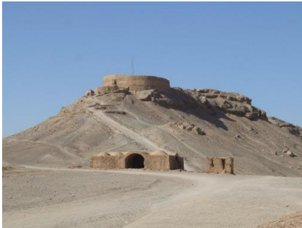
Görsel 3. Sessizlik Kulesi, İran [27]

Hemen hemen tüm toplumların kültürel öğeleri içerisinde yer alan kuş imgesi kanatlara sahip, uçabilen bir canlı oluşu nedeniyle çoğunlukla gökyüzüyle ilişkilendirilmiştir. Toplumların göğe atfetmiş oldukları kutsiyet bu imgeye bir takım spiritüel anlamlar kazandırır. Kanatlarının olması ve gökyüzünde uçabiliyor olmaları Tanrı, melekler ve ruh gibi kuşların da bir takım mistik unsurlarla ilişkilendirilmelerine neden olmuştur. Anadolu'daki eski mezar taşları üzerinde kuş figürlerine rastlanmakla beraber ölen kişinin ardından "can kafesinin kuşu uçtu" şeklinde ifadelerin kullanımı da mevcuttur.