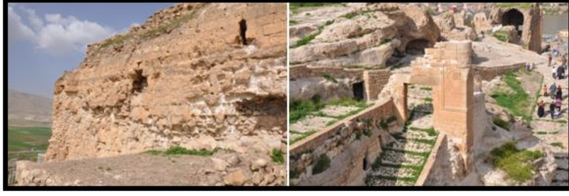
Şekil 5. Bozunmuş kale duvarı ve sağlam kale kapısı (Figure 5. Weathered castle wall and unweathered castle gate)