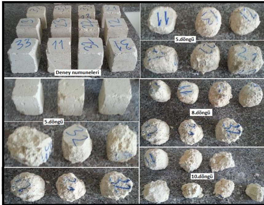
Şekil 4. Tuz kristalleşmesi sonrası bozunmuş numunelerden örnekler (Figure 4. Examples to degraded samples after salt crystallization)

Tuz kristalleşmesinden kaynaklanan bozuşma ile fiziksel özellikleri arasında güçlü bir ilişki bulunmaktadır. Örneğin, Yüksek gözenekliliğe sahip numunelerin daha hızlı bozduğu gözlenmiştir. Kuru ağırlık kaybı testinden sonra, örneklerde ayrışma gözlenmiştir. Bozuşma, ilkönce numunelerin köşelerinde başlamıştır. Alt tabakalardan alınan numuneler ilk 5 döngü sonrası dağılmaya başlamıştır (Şekil 4; Tablo 2). Numunelerde bozuşma, suda dağılma dayanım deneylerinde de gözlemlendiği üzere (Şekil 3) homojen gerçekleşmemiştir. Yani aynı bloktan veya tabakadan alınan numunenin biri bozulurken diğeri sağlam kalmıştır. Alt tabakalardan alınan numunelerin tamamı 10. döngüye kadar tamamen ayrılmış-dağılmıştır ve kuru ağırlık kaybı hesaplanamamıştır. Üst tabakadan alınan numuneler ise 15 döngülü süreci sağlam olarak tamamlamıştır. Numunelerin yüzeyinde ve köşelerinde aşınma gözlenmiştir.