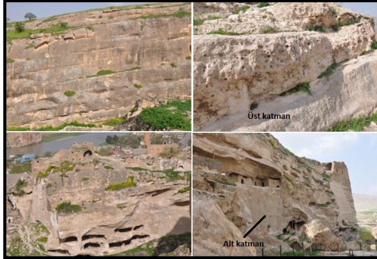
Şekil 2. Tabakalanmalar ve mağaralar (Figure 2. Stratigraphy and caves)