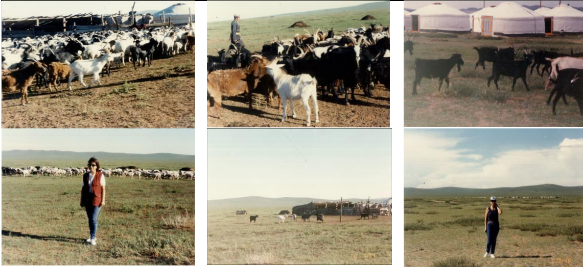
Resim 4. Moğolistan Orhun Köyü ve çevresi Tiftik keçisi çiftlikleri (F. Ayhan arşivi, 2010)

(Figure 4. Orhun village of Mongolia and surrounding mohair farm)