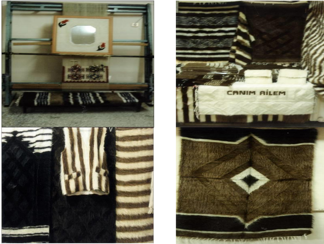
Resim 2. Tiftik keçisi ürünleri ev ve giysi örnekleri (Figure 2. Mohair products household and clothing samples)