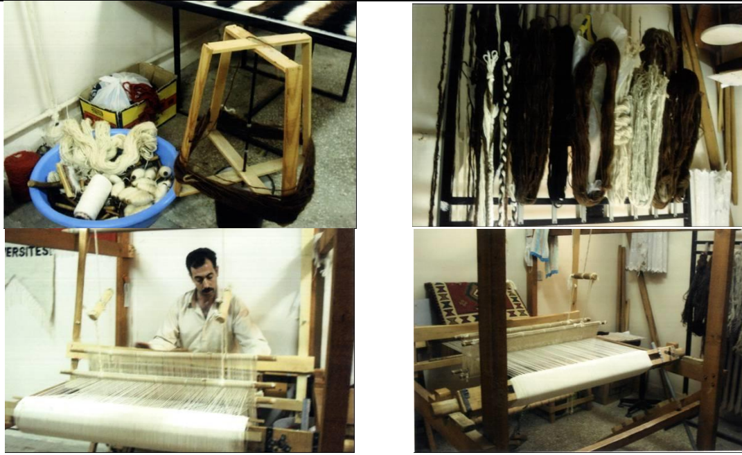
Resim 1. Tiftik ipinin boyanması ve işlenmesi süreci (a) İpliğin bükünü, b) Kurutulması c) Tezgaha alınması d) İşlenmesi (Figure 1. Painting and processing process of mohair (a) Twisting your yarn, b) Drying, c) Countertop retrieval, d) Processing)