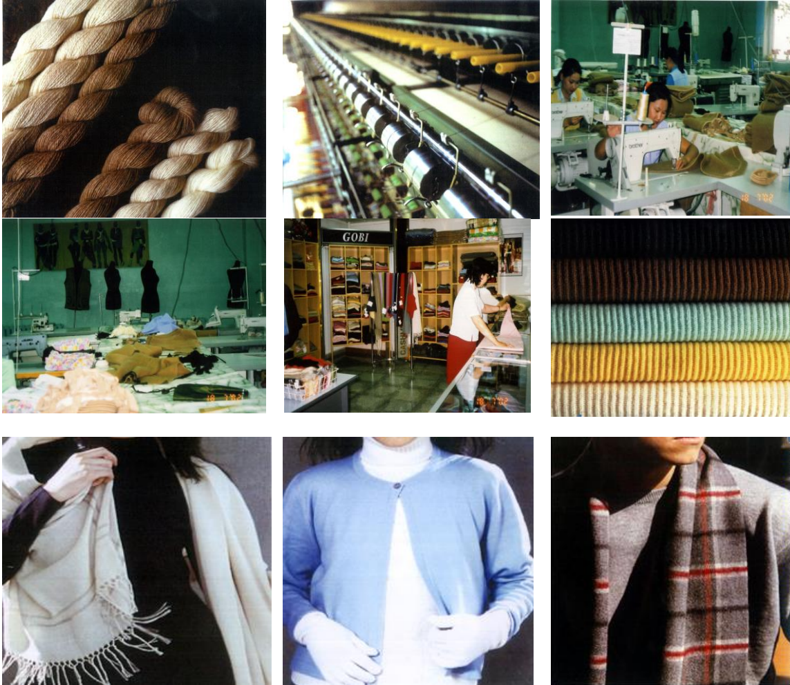
Resim 5. Tiftik ipliğinden ürüne dönüşüm örnekleri (Moğolistan Ulaanbator Gobi Fab.)

(Figure 4. Orhun village of Mongolia and surrounding mohair farm)