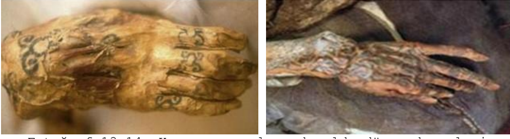
Fotoğraf 13-14. Kurgan mumyalarında elde dövme desenleri (Photo 13-14. Hand tattoo designs on Kurgan mummies)