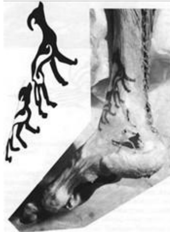
Fotoğraf 21. Kurgan mumyalarında ayakta dövme desenleri (Photo 21. Standing tattoo patterns on Kurgan mummies)

İç Asya'da Proto Türklerin ve Hunların dövme desenleri oğlak ağırlıklıydı. Pazırık kurganları ve Ukok kurganlarından çıkarılan mumyalanmış cesetler üzerinde yapılan incelemelerde, bu hayvan ağırlıklı dövme desenlerinin, sanat değeri yüksek, çok profesyonelce yapıldığı bilinmektedir (Fotoğraf 6). Türklerin Orta Asya'dan Batı'ya göçlerinde farklı kültürlerde etkileşim içine girmiştir. İslamiyet'in kabulü ile yaşamlarında farklı değişiklikler meydana gelmekte birlikte, tarihsel arkaik çizgilerini korudukları da görülmektedir. Kültür inançlarına, sosyal yapılarını yansıtan dövme, kuşaktan kuşağa kimlik ve devamlılık