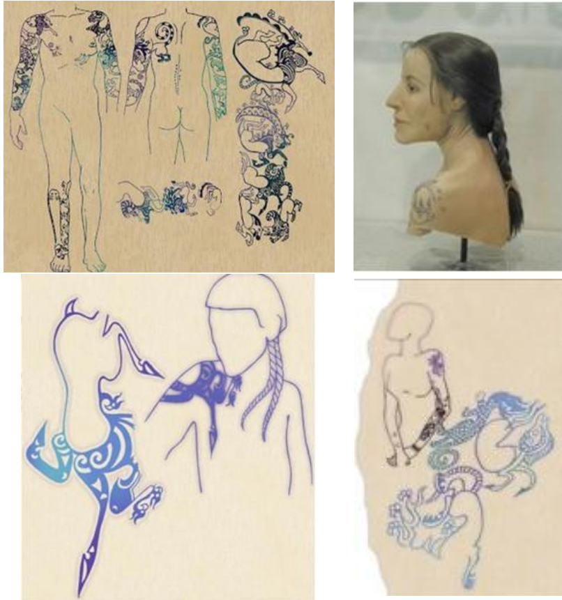
Çizim 11. Altay kurganlarındaki mumyalanmış ceset üzerindeki dövme desenleri (Illustration 11. Tattoo patterns on the mummified corpse in Altai kurgans)

Dinsel büyüsel kaynaklı bu dövmelerin is olduğu, bulunan bir boyanın, deriye şırınga edilmesi ile oluştuğu düşünülmektedir [11]. Dünyanın birçok yerinde olduğu gibi, Hunların ve daha sonraki Türk topluluklarının sanatlarında da dövme görülmektedir. İskit (Saka) kurgan buluntularında mumyalanmış cesedin bacak ve kollarında dövme "motifi olarak hemen hemen yalnız hayvanlar ve hayvan uzuvları kullanılmıştır. Hayvanların en çok yer verilen ve dikkati çekenleri geyik, keçi, kedi, köpek, kurt, at, ayı ve yırtıcı kuşlar gibi ekseriyeti yabancı olanlar" görülmektedir [12] (Çizim 11), (Fotoğraf 1-6).