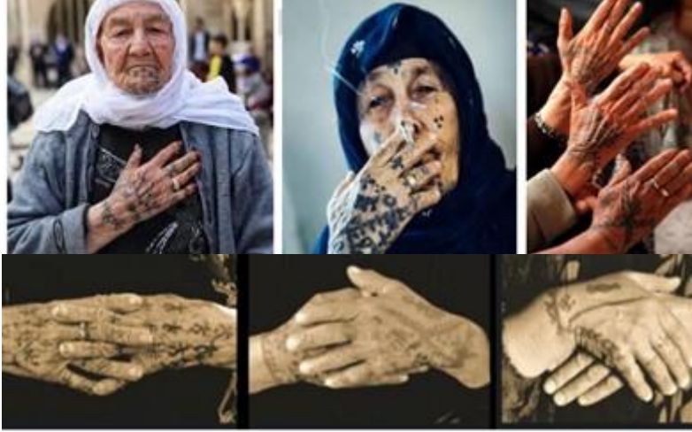
Fotoğraf 15-20. Günümüzde elde dövme desenleri (Photo 15-20. Hand tattoo designs today)