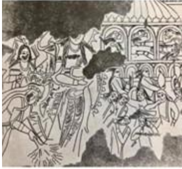
Çizim 1. Göktürk duvar resminde (6. ve 7. yy) bir türk beyinin ölümüne ağlayan halk (Drawing 1. People crying for the death of a Turkish gentleman in göktürk wall painting (6th and 7th centuries))

öldü, Issık halkının başı sağ olsun" diyor ve büyük ağıtlar yakılıyor, oğlunu öldüren Pers kralının kafasını kestirip kana susayan kral Dairus iç diye kan dolu leğene kesik başı buluyor [7]. Bu giysi Kazakistan'da yol yapımı kazısı sırasında tesadüfen bulunan Altın Elbiseli Adam giysisidir [5]. Altın elbiseli adam sergisi, Kazakistan devleti tarafından 2019 Ekim ayında Ankara Anadolu Medeniyetleri Müzesi'nde 1 ay süreyle sergilenmiştir [3]. Alp Er Tunga'ya yapılan tören ve ağıtları, yağ törenleri Bilge Kağan Anıtı'nda bugün hala görülmektedir. Költigin külliyesinde büyük siyah giysili, elinde ağlama mendili olan sığıtçı kadın heykeli fotoğraf 2 de görülmektedir [6]. Uygur duvar resimlerinde de sığıtçı kişiler resmedilmiştir. Türklerin İslamiyet'i kabulünden önce Şamanizm'de oldukları bilinmektedir ve yas törenlerinde de Şamanizm'in izleri görülmektedir (Çizim 1, 2, 3 ve 4).