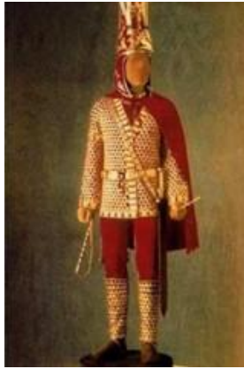
Fotoğraf 1. Altın elbiseli adam (Photograph 1. The man in the golden dress)