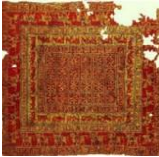
Fotoğraf 3. Pazırık halısı (Tarihte bilinen ilk halı) (Photograph 3. Pazırık carpet (The first known carpet in history))

Defin töreninde at kuyruğunu kesme yoluyla sembolleştirilmiş oluyordu. Defin töreninde at kuyruğunu kesme adetinin M.Ö. 3. ve 4. yüzyıllara mevcut olduğu Altaylar 'da yapılan kazılarda pazırık mezarından çıkarılan donmuş atların kuyruklarının kesik olması ve pazırık halılarında kuyruğu kesik ve bağlı atların bulunması bu geleneğin ne kadar eskiye dayandığını göstermektedir (Fotoğraf 3, Fotoğraf 4 ve Fotoğraf 5). Bu yas geleneğini bütün Türk boylarında görmek mümkündür [24]. Malazgirt Savaşı'ndan önce Alparslan'ın atının kuyruğunu kesmesi kendisini şehit diye adadığını gösteriyordu [36].