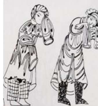
Çizim 4. Varka ve gülşah mesnevisinde ağlayan ağıt yakan kadın çizimleri (Drawing 4. Drawings of women crying and lamenting in varka and gülşah masnavi)

Ölen kişinin ruhu insanlara zarar vermesin diye törenler düzenlenirdi. Çok uzakta olan yakınlarının gelmesi de aylarca süreceğinden ölüleri ayrıca mumyalama yöntemi ile bekletilirdi. Bu törenlerde yaşlılar (ağıtçı), sığıtçılar tutulur, ağıtlar yakılır idi. Bu törenlerde yas çadırları, aş çadırları hazırlanırdı, bu gelenekler hala tüm Anadolu ve Türk dünyasında devam etmektedir. Bu törenden sonra "ölü aş" adı verilen yemeğin yalnız dirilere değil, bilhassa ölülere