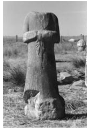
Fotoğraf 2. Sığıtçı kadın heykeli (Photograph 2. The cattleman woman statue)

Büyük ağıtlar yakılan Alper Tunga'nın ölümünden sonra yakılan ağıtların (sağı) yerini bir haftalık yeni evli oğlu Barksan'ın Perslere esir düşüp öldürülmesiyle (Bir rivayete göre Pers askerinin kılıcını alıp ben sizin elinizden ölmem, kendimi öldürürüm diyerek kılıcı kalbine saplar) Tomris hatun çok büyük yuğ (Cenaze töreni) düzenliyor, büyük ağıtlar yakılıyor ve gelini Mayda tarafından yapılan kırmızı zemin üzerine altın plakalarla hazırlanan damatlık elbiseleri ile Issık gölü civarında gömülüyor ve annesi onun mama kabını (tasını) yanında gömüyor (Fotoğraf 1). Tasta şunlar yazılmaktadır; "Tiginim (prens) 23 yaşında