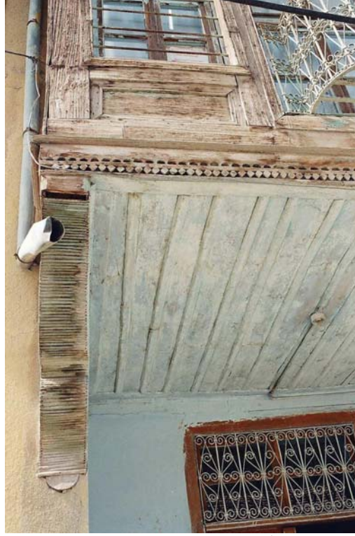
Foto 5. Cumbanın Ahşap İşçiliği (Photo 5. The wooden workmanship of the bay-window)