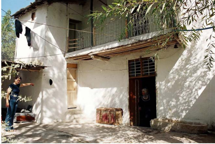
Foto 7. Ömer Bey Konağının Bahçe Kapısı (Photo 7. Gate of the residence of Omer Bey)