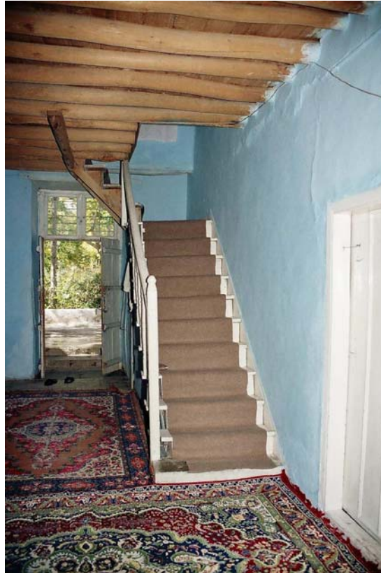
Foto 6. Konağının Giriş Holü ve 1.Kat Merdiveni (Photo 6. The entrance of the residence and first floor's stairs)