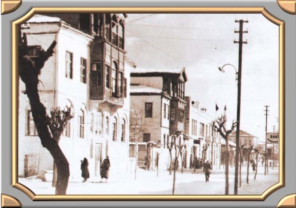
Foto 2. 1930'larda Elazığ Gazi Caddesindeki Konaklar (Photo 2. The residences on Gazi Street in 1930's)