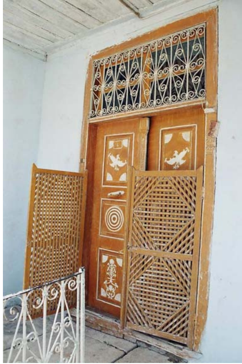
Foto 4. Konağın Giriş Kapısı (Photo 4. The entrance of the residence)