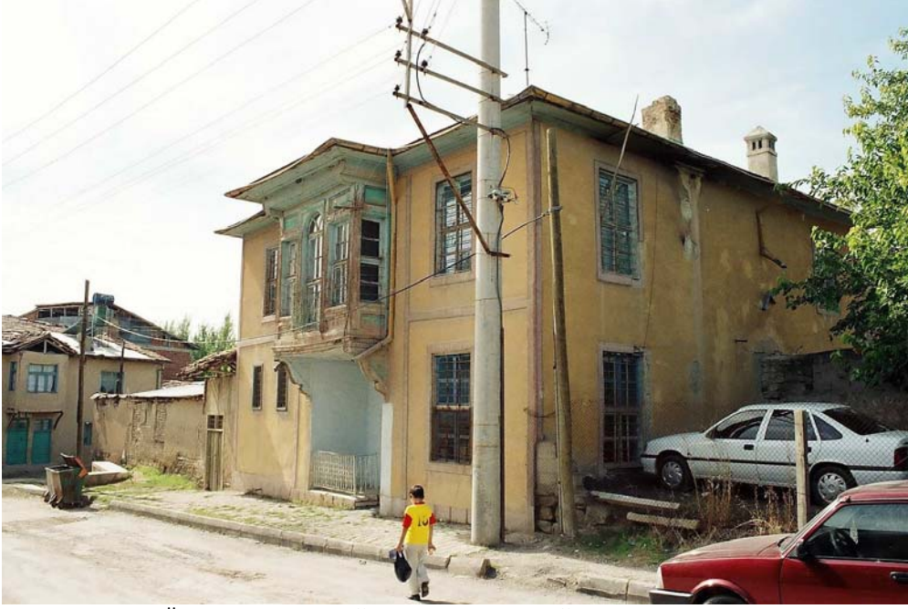
Foto 3. Ömer Bey Konağının Kuzey-doğudan Genel Görünüşü (Photo 3. General appearance of the Omer Bey residence from the North)