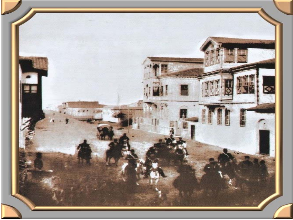
Foto 1. 1890'larda Elazığ Gazi Caddesindeki Konaklar (Photo 1. The residences on Gazi Street in 1890's)