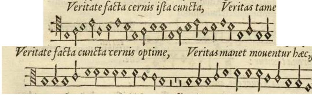
Örnek 2. "De musica libri septem" in 308. sayfasında yer alan bir sonraki yüzyılda Folia melodisi olarak yer almış melodi. (Example 2: The melody in page 308 of "De musica libri septem" named as Folia melody in the following century)