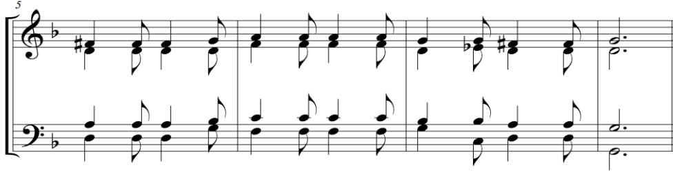
Örnek 3. Salinas'ın Folia melodisinin varsayımsal düzenlemesi ("De musica libri septem", 1577) (The New Grove Dictionary of Music and Musicians, second edition, sayfa 61'de yer alan örnek 1'deki Folia melodisinden uyarlanmıştır).

( Example 3: Presumptive arrangement of Salinas's folia melody (De musica libri septem", 1577) (It was adapted from Folia melody in page 61, example 1 in The New Grove Dictionary of Music and Musicians, second edition)