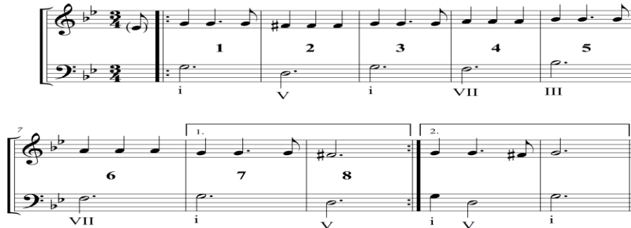
Örnek 5. Geç dönem Folia (Example 5. The Later Folia)

Aşağıda The New Grove Dictionary of Music and Musicians, second edition, sayfa 62'de yer alan Örnek 3'deki Folia melodisinden uyarlanan örnek verilmiştir.