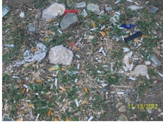
Fotoğraf 7. Harput Kalesi'ndeki çevresel kirlilik Photos 7. Environmental pollution in the Harput Castle

Tablo 13 verileri değerlendirildiğinde; örneklem grubu, soruya verdiği %76,2'lik cevapla, tarihi ve kültürel varlıkların korunmasında gerekli hassasiyet ve çabanın gösterilmediğini aynı zamanda çevrenin kirletildiğini ifade etmiş olmaktadır. Bu sonuç dikkate alındığında; halkın tarihi bilinç, tarihi çevre ve tarihi çevreye duyarlılık gösterme, tarihi ve kültürel varlıkları koruma, sürdürülebilirlik hususunda yeterli bilinç düzeyinde olmadığına, yerel yetkililerin de önleyici ve tedbire yönelik gerekli çalışmaların yapılması konusunda yetersiz kaldıklarına işaret etmesi açıısından anlamlıdır.