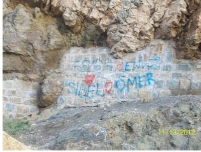
Fotoğraf 1. Harput Kalesi'nin giriş kısmı görünümü (Photos 1. View of the entrance of the Harput Castle)

Tablo verilerine göre "fikrim yok" diyenlerin sayısı "katılmıyorum" diyenlerin sayısından daha fazladır. Bu durum, örneklem grubuna mensup 61 kişinin Harput'a gitmedikleri veya Harput'u merak etmedikleri şekliyle algılanabileceği gibi bu 61 kişinin Elazığlı olmadıklarına da işaret edebilir. Harput Kalesi'nin giriş sol tarafına ait Resim 1'deki görüntü, tarihi ve kültürel varlıkların hoyratça kullanıldığını ve bilinç düzeyini göstermesi açısından anlamlıdır.