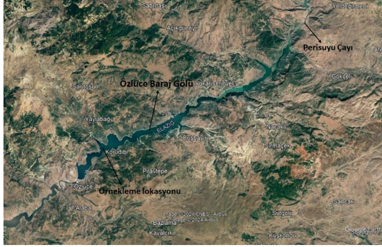
Şekil 1. Balık örneklemelerinin yapıldığı Özlüce Baraj Gölü ve örneklem lokasyonu [24] (Figure 1. Özlüce Dam Lake where fish samples were taken and the sampling location)

Özlüce Baraj Gölü (Şekil 1), Bingöl ilinin Yayladere ilçesi sınırları içerisinde yer alır. Kamu tarafından inşa edilmiş olup, yine işletilmesi de kamu tarafından yürütülmektedir. Yıllık elektrik üretimi yaklaşık 454GWh'tir. Minimum işletme kotu 105 metre, maksimum işletme kotu ise 1141m'dir. Bu barajda balık geçidi mevcut değildir [18 ve 20].